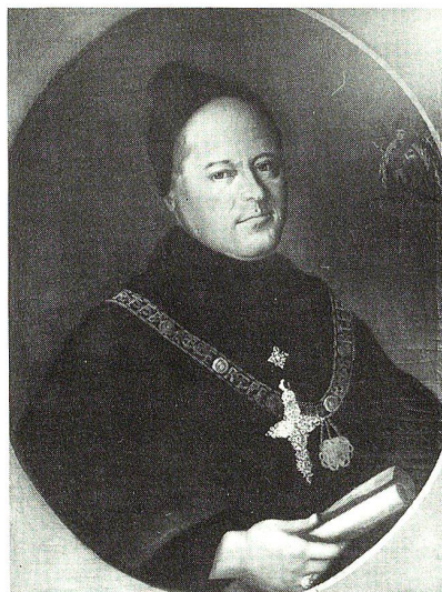
Abt Beda Angehrn. Kopie eines Ölporträts im Stiftsarchiv.

nehmen ist, dass Neresheim wirklich alles aufgeboten hatte, um den gefürsteten Verwandten seines Abtes würdig aufzunehmen und ihm die Tage so genussreich wie möglich zu machen. In bunter Folge wechselten Musikdarbietungen mit hochgelehrten Disputationen, Besichtigungsfahrten