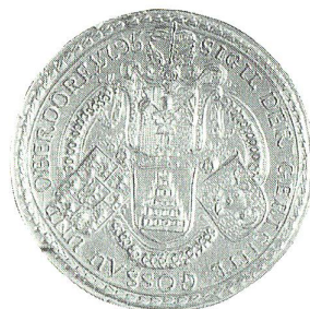
Oben: Erst nach langem Widerstand willigte der St. Galler Konvent ein, den «Gütlichen Vertrag» mitzubesiegeln. Stiftsarchiv St. Gallen, Konventssiegel (Gallus und Bär), Durchmesser 3,8 cm. Stiftsarchiv St. Gallen, Abdruck auf Urkunde B1 B52.