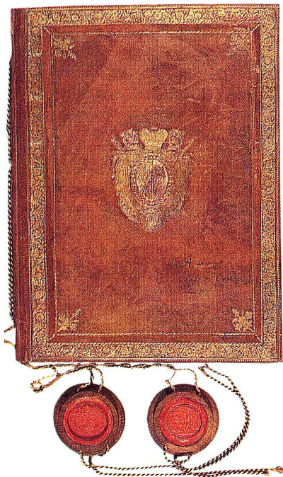
Der «Gütliche Vertrag» vom 23. November 1795: Ledereinband mit eingepprägtem St. Galler Abteiwappen und mit den angehängten Siegeln von Abt und Konvent. 30 x 39 cm. Stiftsarchiv St. Gallen, Urkunde W3 A55b.

hindern, und wandte sich diesbezüglich an die Schirmorte.