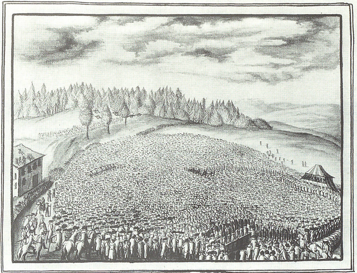
Landsgemeinde des Aargauer Volkes, gehalten in Gossau, den 23. Novbr. 1795, gezeichnet durch Johann Künzli

Volkes eingeführt hätten. Klar und deutlich wird die Aufhebung der Leibeigenschaft gefordert.