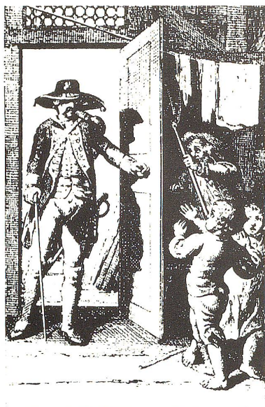
Ulrich Bräker in preussischer Uniform: Bei der Heimkehr aus dem Söldnerdienst (1756) wird er von seiner Familie im ersten Moment nicht erkannt.