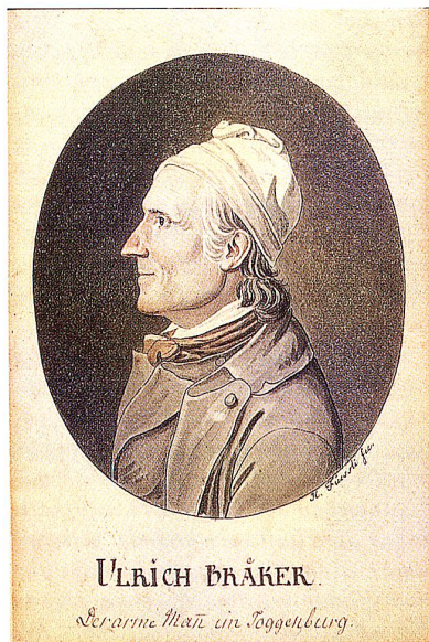
Ulrich Bräker, der Arme Mann im Toggenburg. Auch Bräker, der als Weber und Fergger sein Geld verdiente, geriet durch die Wirtschaftskrise 1795 in schwerste Armut, von der ihn nur noch 1798 der Tod erlöste. Der aufgeklärte Toggenburger war jedoch kein Freund der Revolution, sondern ein Liebhaber echter Bildung und einer friedlichen Zusammenarbeit zwischen Volk und Landesherrn. Kolorierter Umrissstich von H. Füssli, 1797.

schämen zu betteln, herrscht Hunger. Das Verdienst ist noch so ziemlich gut, aber doch reicht es nicht hin, alles Notwendige anzuschaffen, denn die Teuerung ist im ganzen viel stärker und anhaltender als in den hungrigen 70er Jahren. 10