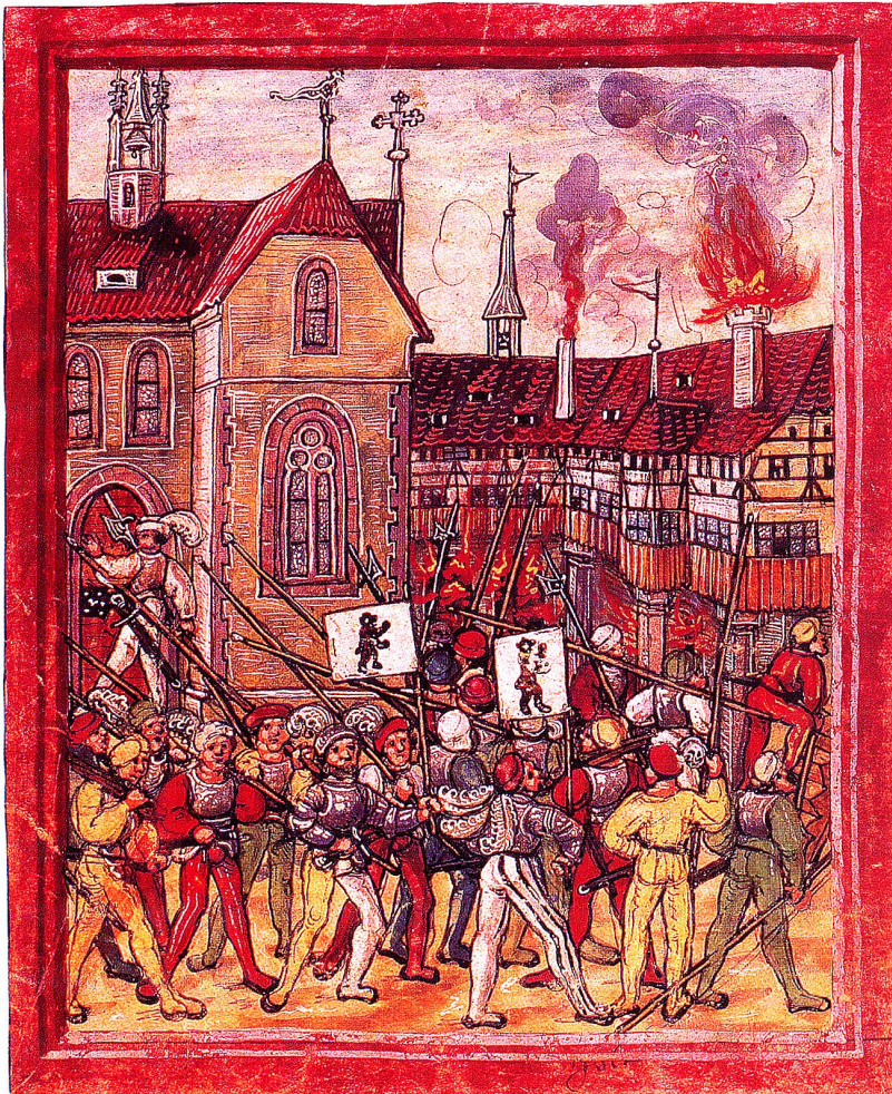
Zerstörung der neuen Klosterbauten bei Rorschach durch Stadsanktgaller und Appenzeller, 1489, Diebold Schilling, Amtliche Luzerner Chronik.

Der Klosterbruch in Rorschach und der St.Gallerkrieg von 1489/90 machten dann allem ein Ende. (Beim Klosterbruch hatte sich übrigens «die Frucht der städtischen Umtriebe» aufs Schönste gezeigt: Wer Ausbürger in St.Gallen war, stand natürlich nicht für den be-