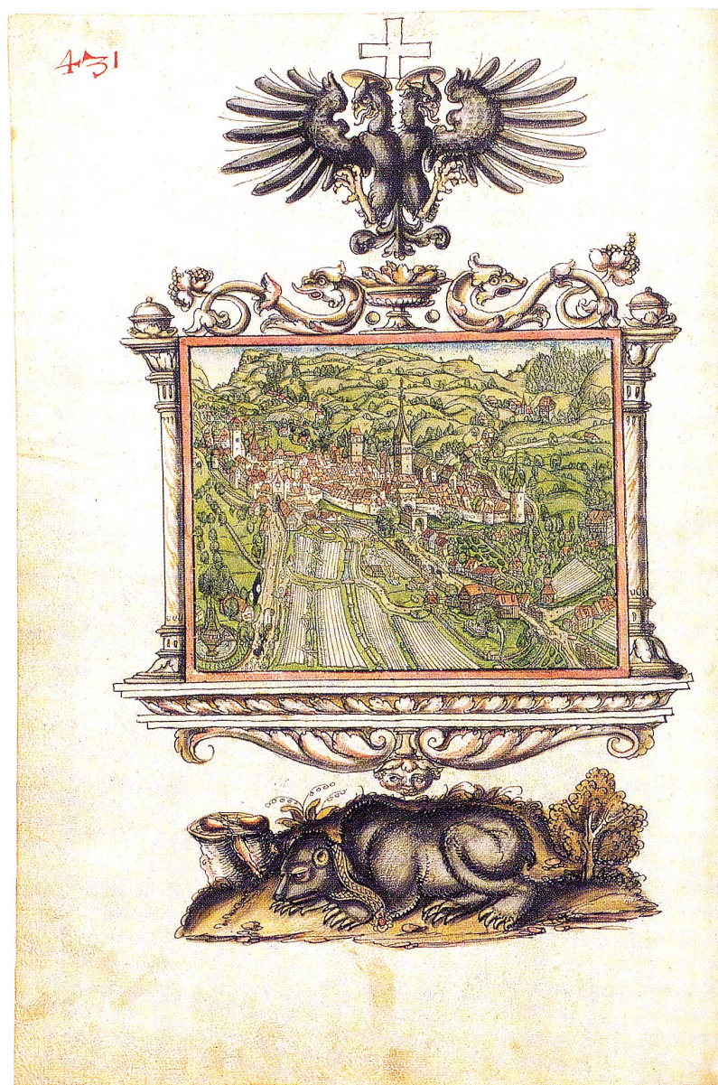
Die Stadt St.Gallen von Westen, Abschrift der Vadian-Chronik von Wolfgang Fechter, 1549.

Es kam offensichtlich immer wieder vor, dass auswärts, «zu Lyon und anderwärts in der Fremde» wohnende Bürger nach ihrem Belieben Steuern zahlten. 1671 bevollmächtigte der Grosse Rat den Kleinen Rat, falls ein auswärtiger Bürger ein ehrliches Angebot mache, könne er «nach Befinden und gestaltsame der Sachen» verfahren. «Beinebens» empfahl er, es sollen jene Bürger in der Fremde, die aus Erlaubnis bisher eine gewisse Summe, jedoch nach Beschaffenheit ihres Vermögens gar zu wenig, versteuert haben, vom Kleinen Rat durch ein Schreiben ermahnt werden, diese Steuer billigermassen künftighin «auf ein Höheres