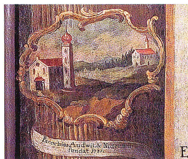
Im Jahre 1731 wurden Andwil und Niederuzwil zu eigenen Pfarreien erhoben und damit von Gossau losgelöst (Medaillon im Gang der Stiftsbibliothek).