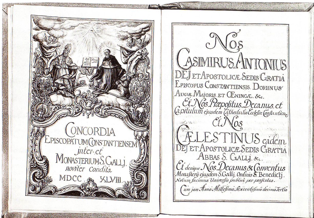
Frontispitz der Übereinkunft zwischen St. Gallen und dem Bistum Konstanz vom Jahre 1748. Damit wurden dem Kloster die Seelsorgerechte in den Pfarreien des Fürstenlands und des Toggenburgs erneut bestätigt.

den sollen. Allein der Zweite Kappeler Landfrieden bewirkte eine Kurskorrektur und rettete das Kloster. Abt Diethelm Blarer (1530–1564) führte darauf die Rekatholisierung im Fürstenland mit Erfolg durch. Im Toggenburg und im Rheintal kam das Recht auf freie