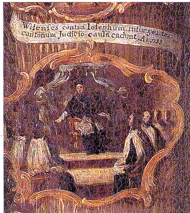
Auf Klerusversammlungen gaben die Äbte ihren Priestern wesentliche Impulse für eine zeitgemässe Pastoral (Medaillon im Gang der Stiftsbibliothek).

(1767–1796) und Abt Pankraz Forster (1796–1805). Von Abt Beda berichten spärliche Tagebucheinträge aus dem Jahre 1770 von einer kleinen visitorischen Tätigkeit. Abt Pankraz kündigte im Dezember 1796 in einem Rundschreiben an alle Seelsorger seinen geplanten Besuch an. Die politischen Verhältnisse und die Vertreibung der Mönche im Jahre 1798 verhinderten dessen Durchführung. 12 Die aus diesen zwei Jahrhunderten erhaltenen Visitationsprotokolle oder -berichte geben ganz mannigfachen Einblick in das kirchliche Leben und in den Alltag auf dem Lande. Ihre Lektüre lässt die Anliegen der klösterlichen Herrschaft und aktuelle Probleme erkennen. Besonders im 18. Jahrhundert wurden nicht nur die Geistlichen geprüft, sondern auch der Mesmer und der Schulmeister – also Menschen, die des Lateins unkundig waren. Die entsprechenden Partien sind dann auch in