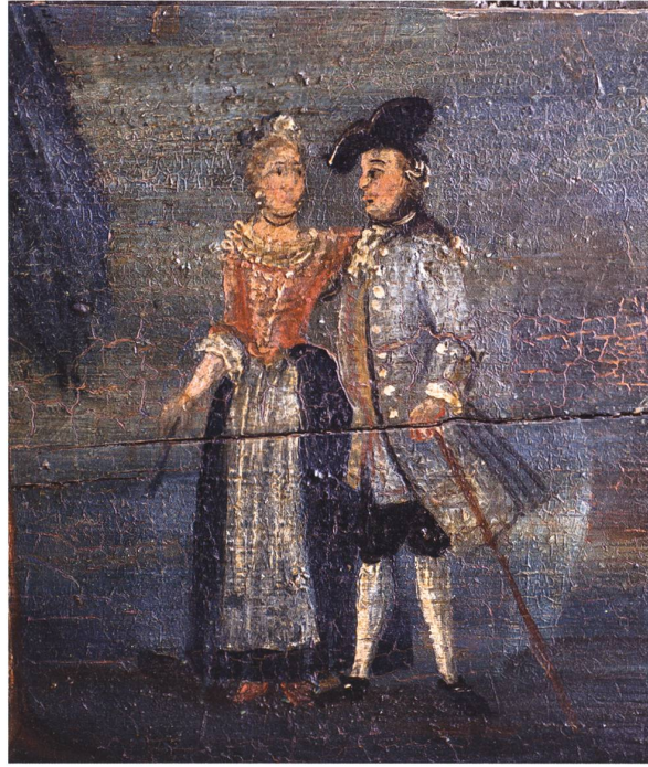
Ganz anders gewandet, demonstriert dieses Paar, sich in der gleichen freien Natur ergehend, den sozialen Unterschied.

Walser! 7 Man stelle sich vor, der ganze Auftritt vor der Kulisse der barocken Klosterbauten.