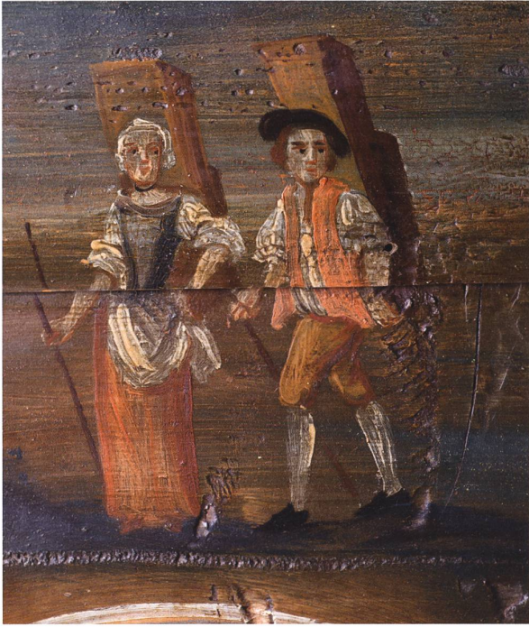
Was vertragen die Beiden in ihren Rückenkästen? Sind es Textilien, ist es die Post? Was Ihre Kleidung anbelangt: So war man hier angezogen auf dem Land.