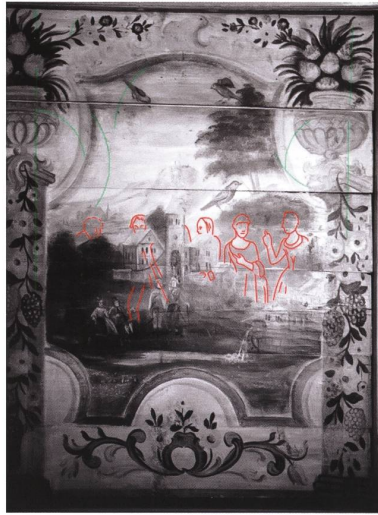
Tafel 2: Konturen der unteren Malschicht gemäss der Infrarot-Untersuchung (2012 auf restaurierungen GmbH, 8706 Meilen ZH).

Zum Schluss noch eine Anmerkung – mehr kann es leider nicht sein. Auf zwei Bildtafeln kann man eine untere Malschicht beobachten, die teilweise durchscheint. Festsustellen sind grosse menschliche Figuren, von der Kostümierung her offensichtlich nur wenig älter. Zu Künzle würde es nun – dachte ich – ausgezeichnet passen, wenn jene untere Bildschicht ein religiöses Szenarium zum Inhalt gehabt hätte, das dem Hausherrn bestimmt zunehmend zum Ärgernis geworden wäre. Falls sich meine Vermutung bewahrheiten würde, wäre der Sachverhalt ein weiteres wichtiges Indiz dafür, dass eben Künzle der Auftraggeber unseres aktuellen Bildzyklus gewesen wäre. Nun zeigte sich die Kantonale Denkmalpflege bereit, eine Infrarot-Untersu-