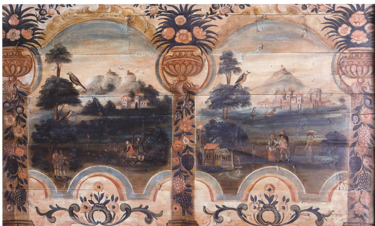
Zwei der drei freigelegten Bilderwände oben im «Säli» des Weibelhauses: Lauter idyllische, heitere Szenen vor prächtigen Naturlandschaften, umgeben und gegliedert von einem üppigen Rahmenwerk.