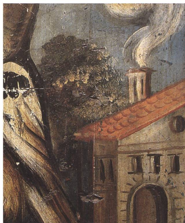
Stube mit den Soldaten. (Historisches Museum St.Gallen)

Luft, Licht und Perspektive leiten da den Blick in die Tiefe, aus der Nähe in die Ferne. Ganz vortrefflich finde