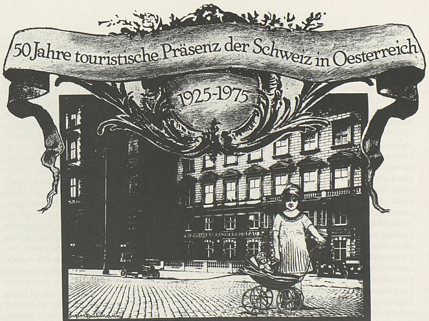
1925-1932: das erste Verkehrsbüro der Schweiz in Wien am Schwarzenbergplatz

Zum Jubiläum der Agentur Wien herausgegeben von der Schweizerischen Verkehrszentrale Zürich