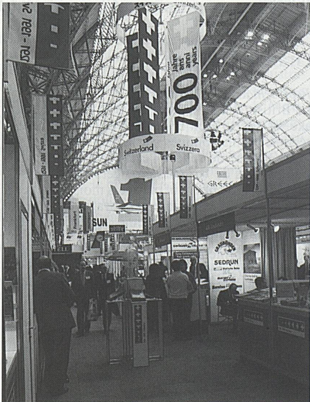
Coup d'envoi du thème promotionnel de 1991 au World Travel Market à Londres.

Nous avons prêté 37 films, 34 séries de diapositives et 784 vidéocassettes à des agences de voyages, écoles et clubs; 7 exposés avec projection de film à 375 spectateurs; 2330 diapositives en couleurs et 352 photos noir/blanc ont été prêtées aux médias, à l'industrie touristique, à des entreprises commer-