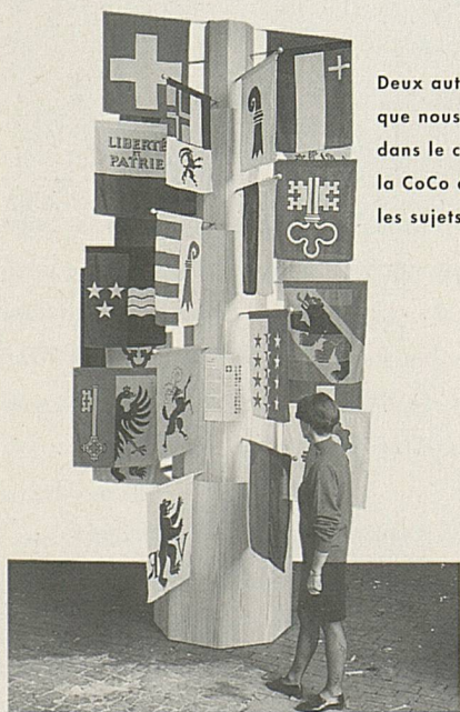
Deux autres «mini-expos» que nous avons réalisées dans le cadre d'un projet de la CoCo de plusieurs années: les sujets «Fédéralisme»...

Nous avons été en contact étroit avec le personnel des ambassades et consulats pour l'organisation de semaines suisses, lors d'expositions, de l'instruction des stagiaires de chancellerie sur le tourisme et lors de la journée de discussion du séminaire de promotion des exportations avec excursion à la Gemmi (sentiers muletiers).