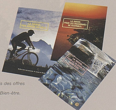
Paquets attractifs des offres Vélo, Festival et Bien-être.