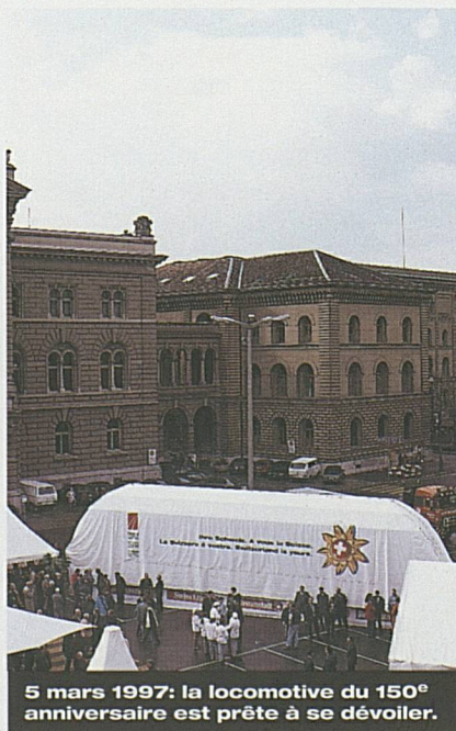
5 mars 1997: la locomotive du 150 e anniversaire est prête à se dévoiler.

La cérémonie officielle d'ouverture du jubilé «150 ans des chemins de fer suisses» a eu lieu le 5 mars 1997 à Berne. Suisse Tourisme a soutenu durant toute l'année les nombreuses activités marquant cet anniversaire. Des programmes spéciaux ont été élaborés sur les marchés les plus importants en collaboration avec les Chemins de fers fédéraux et d'importants voyageurs ferroviaires. Des voyages d'études pour les professionnels du voyage et des contributions dans les médias ont contribué à positionner la Suisse comme pays de voyages en chemin de fer par excellence.