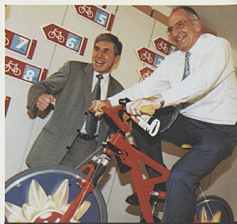
14 mai. Conseiller fédéral P. Couchepin à vélo!

Le 14 mai 1998 ont eu lieu à Zurich trois importantes manifestations de Suisse Tourisme: la 58 e assemblée générale des membres de Suisse Tourisme, à laquelle était rattachée la première remise du label de qualité à 32 entreprises touristiques et, l'après-midi, en présence du conseiller fédéral Pascal Couchepin et de nombreux représentants de la politique et de l'économie, l'inauguration de la nouvelle adresse de