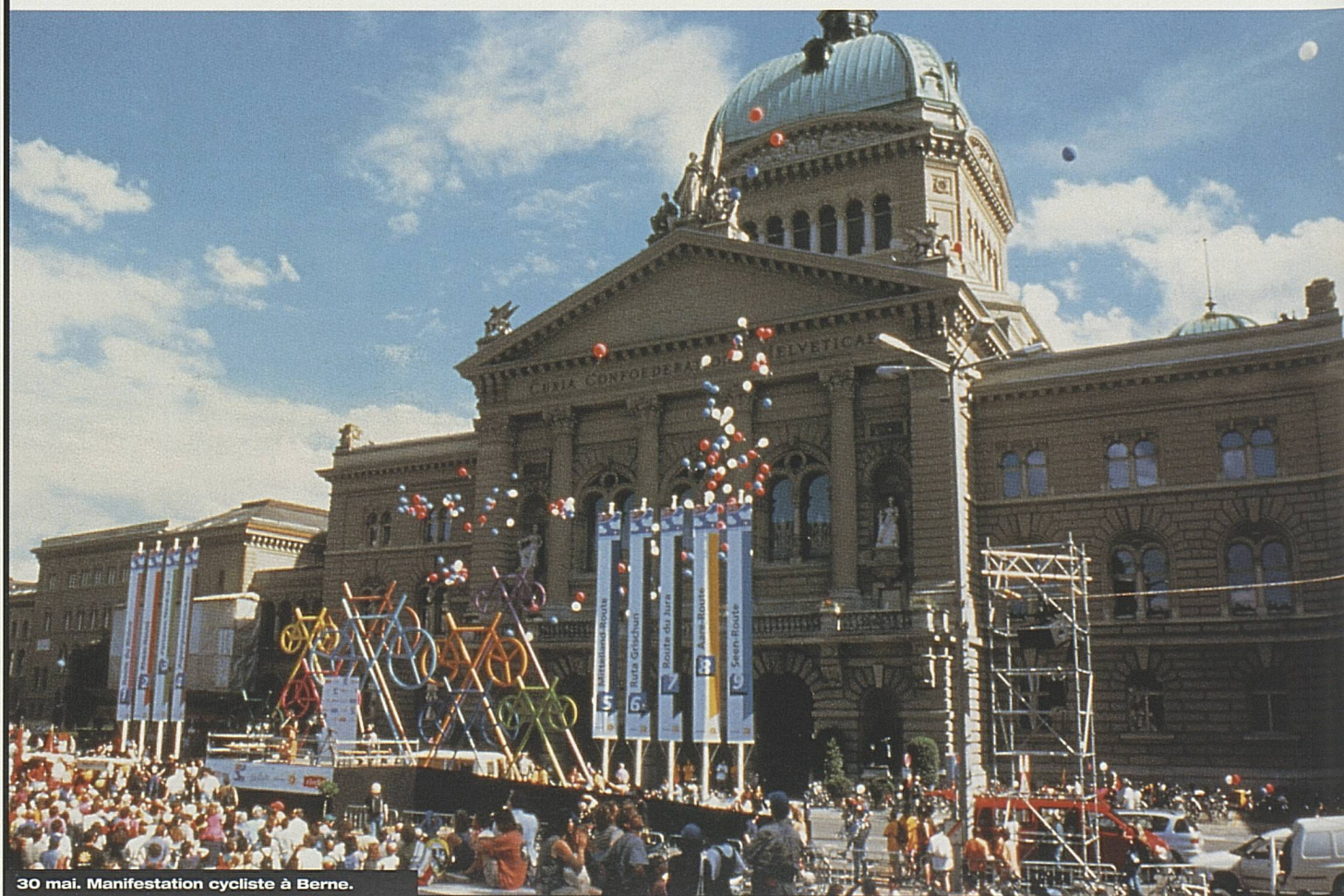
30 mai. Manifestation cycliste à Berne.

Le 30 mai à Berne, «La Suisse à vélo» a été inaugurée en présence du conseiller fédéral Adolf Ogi par un grand événement cycliste. Toute la presse spécialisée et publique de Suisse, de nombreux journaux et magazines étrangers et des stations TV et radio internationales ont fait des reportages sur «La Suisse à vélo».