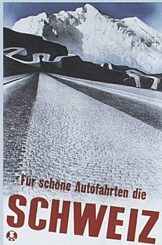
Herbert Matter, En route pour la Suisse, 1935

Un retour en arrière sur presque 85 ans de promotion du tourisme suisse nous montre bien son évolution et sa constance. Au début, ce sont les montagnes légendaires, comme dans l'affiche de l'artiste Emile Cardinaux de 1921: «L'été en Suisse». Jusqu'à ce jour,