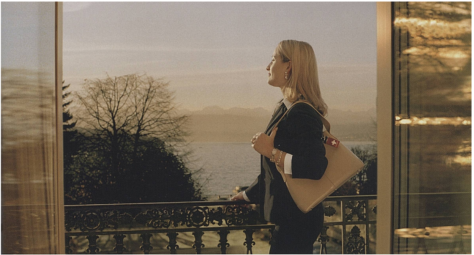
Visuel principal de la campagne «Luxe & Design».