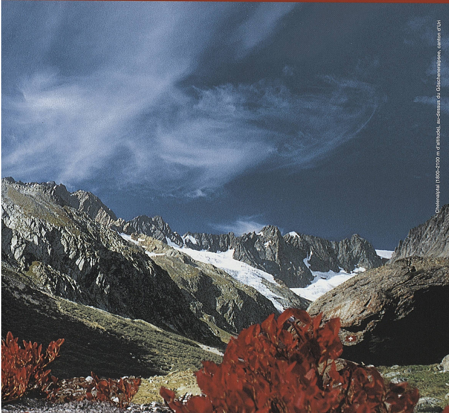
Chelernalp (1800-2100 m d'altitude), au-dessus du Göscheneralpsee, canton d'Uri