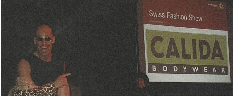
Une ambiance décontractée a régné à l'occasion de l'ouverture de Swiss-Peaks à New York.