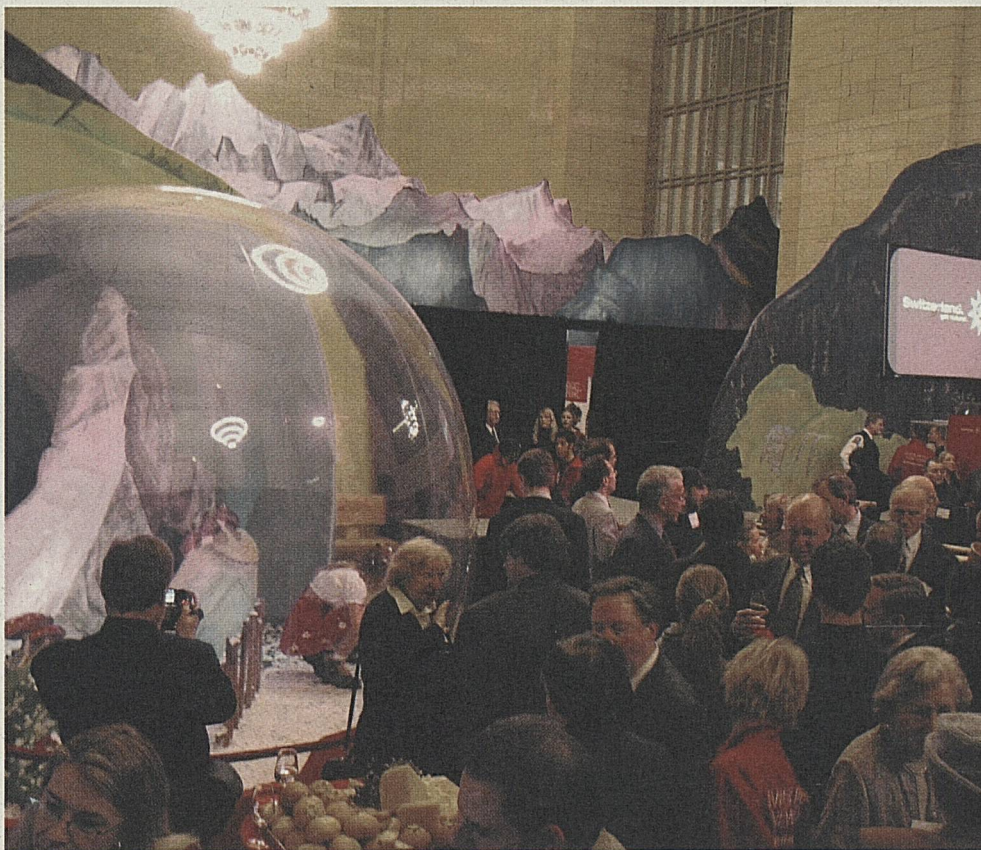
Impossible de passer à côté de la Suisse en miniature. On pouvait toutefois également la sentir, la humer, l'entendre et l'acheter.

L'écho dans les médias a été époustouflant: que ce soit dans le «New York Times» ou le «Wall Street Journal», la Suisse a été omniprésente, les médias électroniques ont parlé en détail de la Central Station. Les New-Yorkais ont été nombreux à vouloir voir le spectacle. La campagne peut être qualifiée d'immense succès.