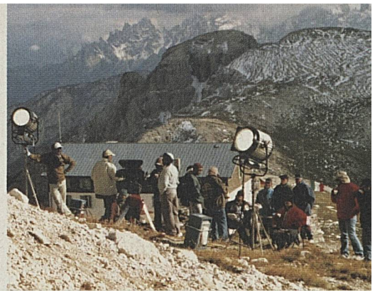
Les équipes cinématographiques de l'Inde aiment la Suisse – la Suisse aime aussi ces professionnels du cinéma.

Pour contrecarrer les offres à bas prix d'autres pays de vacances, Suisse Tourisme essaie de s'adjuger les faveurs des producteurs de Bollywood, Mollywood et d'autres hauts lieux cinématographiques avec le guide «Switzerland for Movie Stars.». Le guide en question contient toutes les informations qui sont nécessaires pour la planification d'un tournage: depuis l'organisation du visa en passant par la réservation d'hôtels offrant des forfaits aux équipes cinématographiques jusqu'aux adresses de traiteurs pour satisfaire le palais gourmand des hôtes. Avec l'aide du Consulat de Suisse à Bombay, Suisse Tourisme a par ailleurs commencé à nouer des contacts précieux et à mettre en place un réseau avec les producteurs de films.