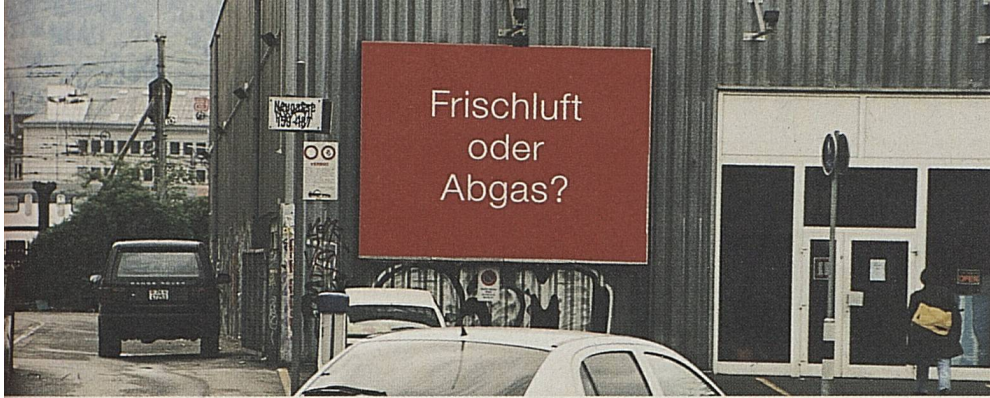
Avec ce qu'on appelle une campagne «Teaser» en Suisse et dans le sud de l'Allemagne...