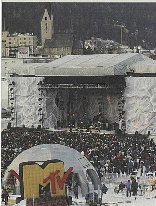
Winterjam: Davos a rocké au rythme de MTV.