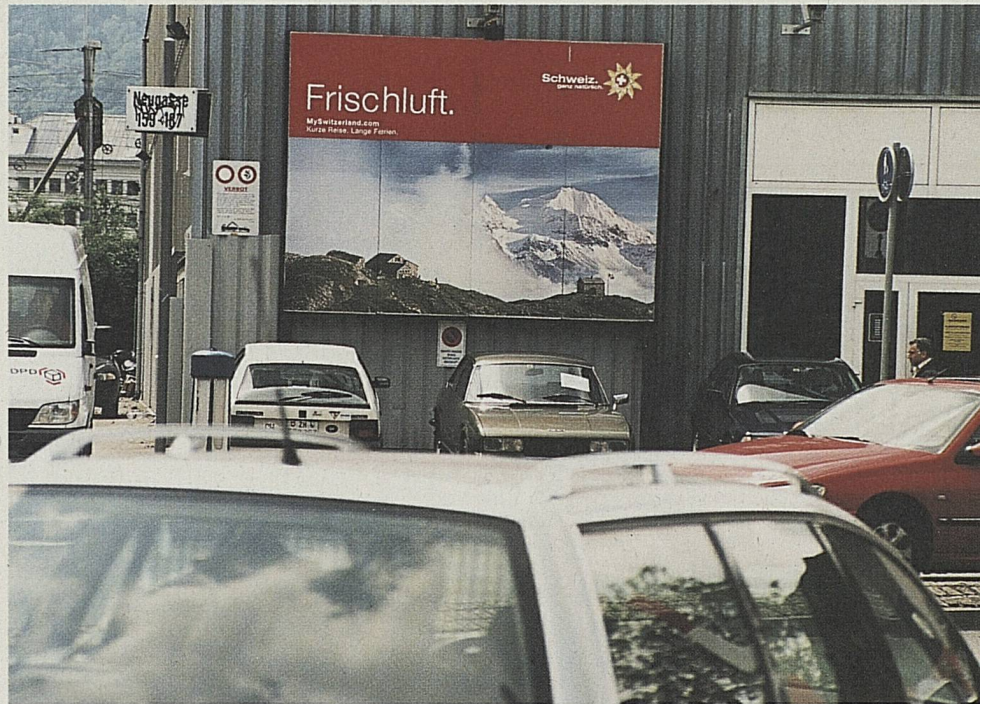
... et son remplacement par une autre forme de message, Suisse Tourisme a communiqué sur la fraîcheur pour les vacances d'été.

Malgré des conditions générales difficiles, Suisse Tourisme avait opté pour une stratégie progressiste et, partant, pour une vaste campagne d'été. Une analyse des effets de la campagne effectuée par l'institut Dichter en a également fait partie. Dans cette analyse, les affiches ont obtenu des résultats nettement meilleurs que les annonces. Conclusion: pour Suisse Tourisme, une publicité par annonces ne s'avère judicieuse qu'en combinaison avec une offre concrète, la publicité par affichage en revanche uniquement comme publicité axée sur l'image.