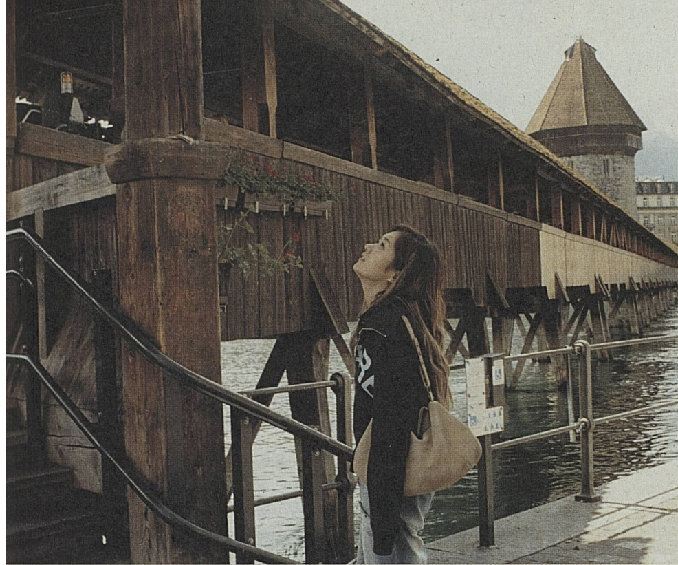
Nara Jang a été impressionnée par les édifices historiques comme le Pont de la Chapelle à Lucerne. Dans la brochure sur la Suisse, la vedette de cinéma raconte ce qui lui a particulièrement plu durant son voyage.