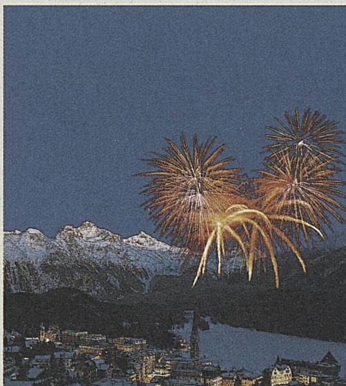
En Russie, la Suisse jouit d'une image noble.