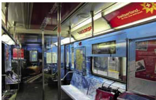
Entièrement aux couleurs de la Suisse: les wagons de la «42 nd Street Shuttle» du métro de New York.

Le «42 nd Street Shuttle» est un métro qui transporte tous les jours quatre millions de New-Yorkais entre Grand Central Station et Times Square. Durant tout un mois au printemps, ses usagers ont vu la vie en rouge et blanc: les rames avaient été décorées aux couleurs de la Suisse, intérieur comme extérieur. Cette opération s'est accompagnée de diverses promotions, événements et concours.