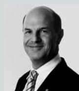
Thomas Winkler Management Portail & E-marketing