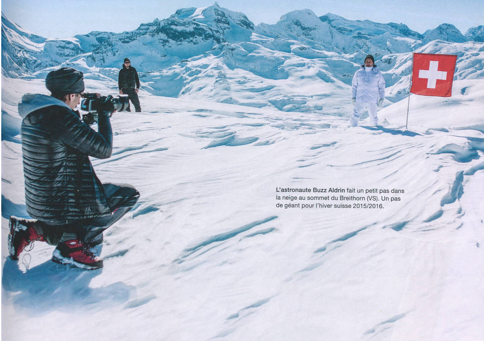
L'astronaute Buzz Aldrin fait un petit pas dans la neige au sommet du Breithorn (VS). Un pas de géant pour l'hiver suisse 2015/2016.