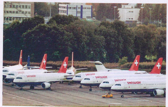
Fin de Swissair après 71 ans, avec l'atterrissage du dernier vol de ligne, le 1 er avril, à Zurich.