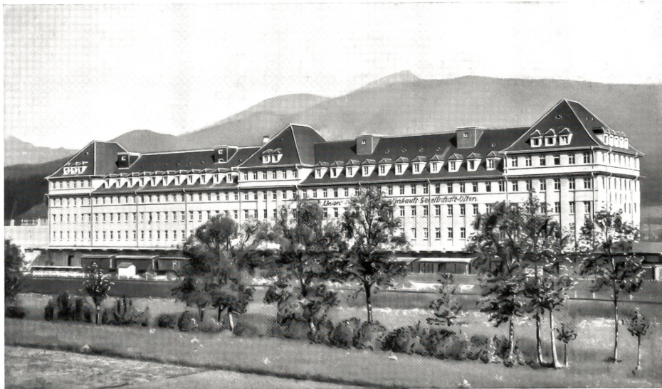
Usego-Lagerhaus Olten 1942