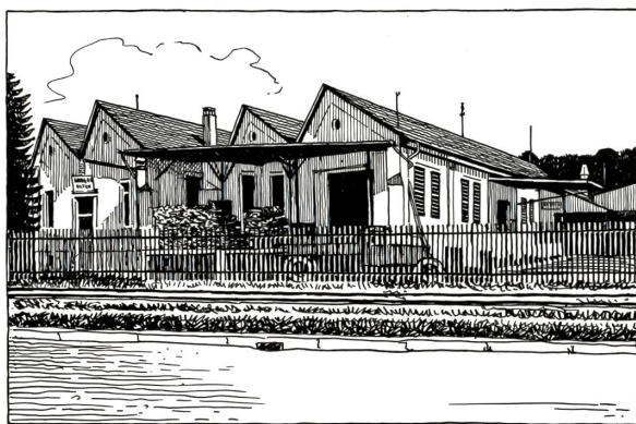
Erstes Lagerhaus 1916 im Oltner Industriequartier

Im Mittelalter noch war der Einzelhandel enger als heute mit dem handwerksmässigen Gewerbe verflochten. Erst in der zweiten Hälfte des vorigen Jahrhunderts begann sich eine Wandlung zu vollziehen, die sich mit dem Beginn des zwanzigsten Jahrhunderts beschleunigte. Das war zu jener Zeit, als die Verbraucher immer mehr sich zusammaten, um die Arbeit der Warenverteilung selber und, wie sie glaubten, besser und billiger zu besorgen. Diese Bewegung entwickelte sich so ungestüm, dass das Schicksal der Glieder des selbständigen Kleinhandels in absehbarer Zeit als besiegelt erschien. An diesen Untergang glaubte man auch in akademischen