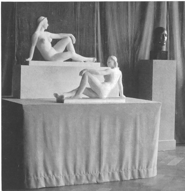
Aventia (römische Fluß- und Quellgottheit)

Was würde kaufmännisch-kunsthändlerischem Sinne heute näher liegen, als den Kreis der von Rupp geschaffenen Frauen-Symbole mit einigen andern von lasziver Körpersprache zu durchwirken, «aufzulockern», wie der Fachausdruck heißt! Gehört doch die Entwürdigung des weiblichen Geschlechtes mit zu den sichtbarsten Erscheinungen unserer weithin dekadenten Zeit (wer das nicht glauben will, werfe einen Blick auf mancherlei Geschäftsreklamen, in illustrierte Zeitungen, auf Einbanddecken von Büchern!). Bei Meister Rupp nicht e i n e solche Figur, nicht e i n e also sprechende Gebärde! Seine Gestalten alle – das mußte bei einer Gesamtschau besonders auffallen – sind von unvergleichlicher Reinheit und Sauberkeit, und gerade dadurch verhelfen sie der dargestellten Weiblichkeit zum großen Durchbruch. Tief ergriffen stand man vor solcher Hochachtung der Frau, und ich komme mir weder veraltet