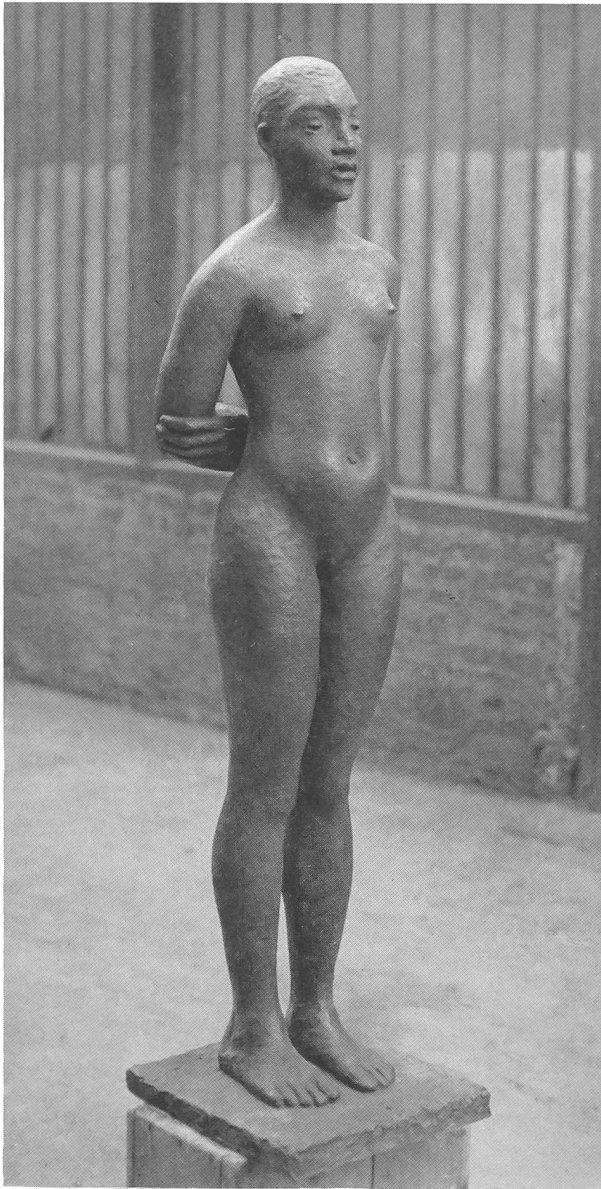
Martiniquaise (Paris 1920)

noch überholt vor, wenn ich hier die Verse aus Schillers «ehernem Munde» anführe: