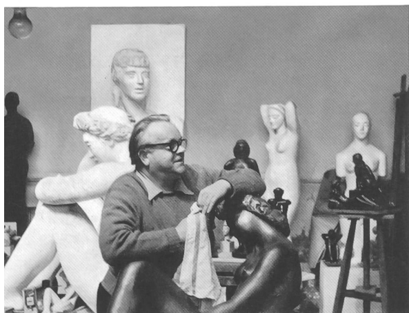
Der Künstler in seinem Atelier in Paris