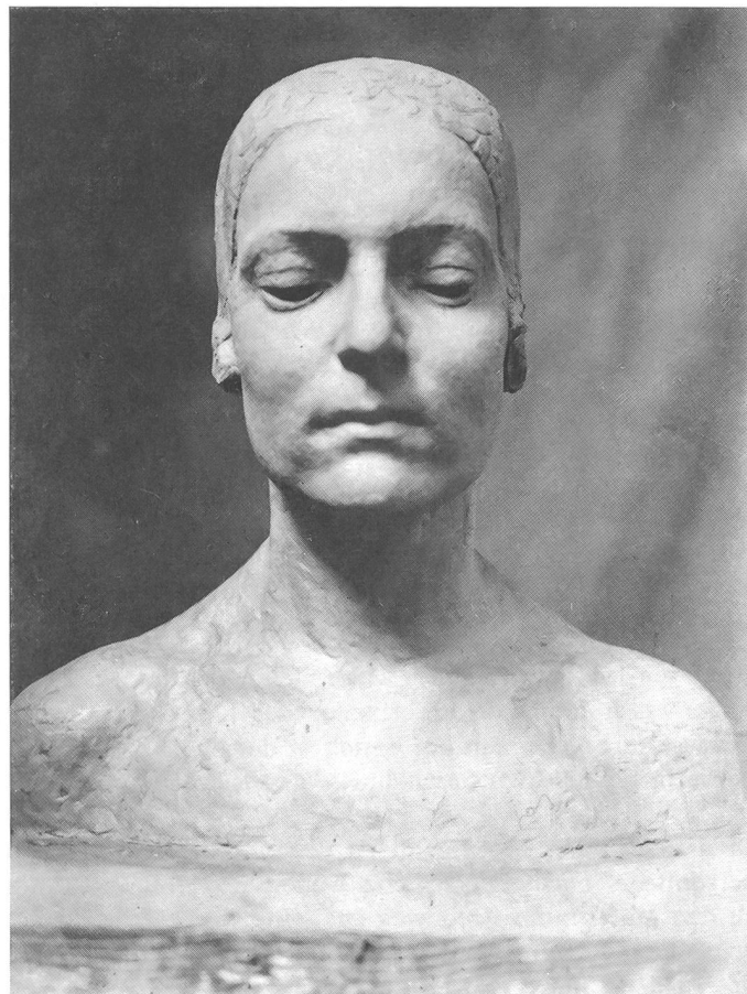
Mädchenbüste (Wien 1928)

Trotz allem regen und reichen Besuch: der Konzertsaal wurde unter dem Eindruck der Rupp'schen Kunst zu einem Raum der Stille. Denn wie aus einer zwar sonnendurchfluteten, aber eben doch aus einer Stille auferstanden, so weisen sie in allem ihrem Wesen doch wieder dahin, woher letzten Endes allein das Große stammt: in die Stille der Einsamkeit. Die aber tut uns not.