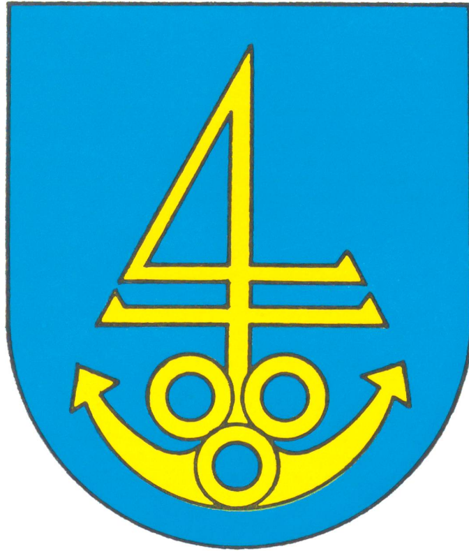
Das Wappen der Schiffleute-Meyer