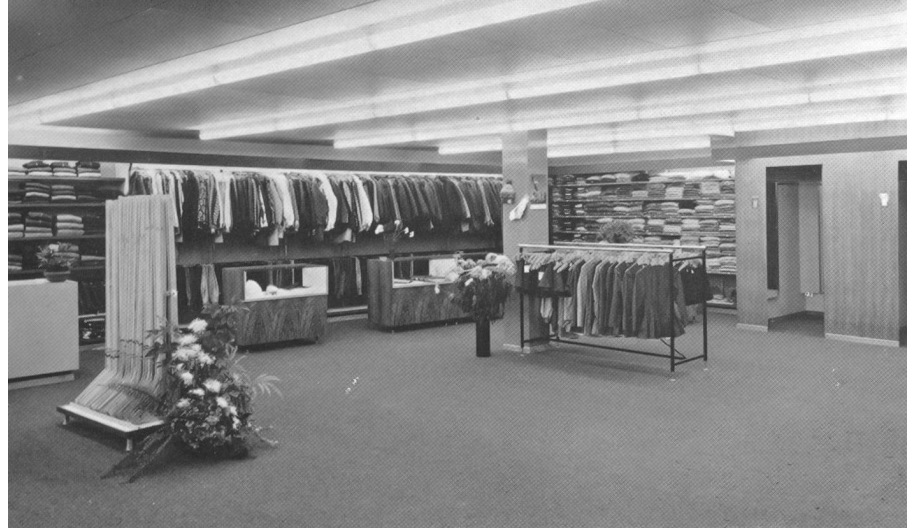
Sportkonfektion, rechts Anprobekabinen.