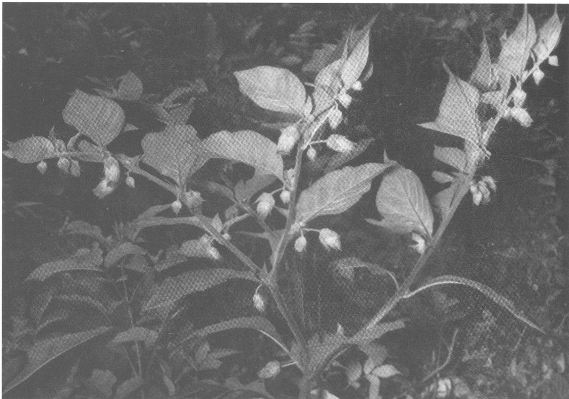
Tollkirsche: blühender Strauch

oder am Gesträuch sich emporrankend, den Bittersüßen Nachtschatten ( Solanum dulcamara ). Ein weißes Geflecht zarter Stengel, eine Blüte mit violetter Radkrone, in deren Mitte die gelben Staubblätter zünden, herzförmige Blätter und korallenfarbene Früchte verleihen dem Halbstrauch ein hoffärtiges Aussehen. Die «Saftmale» im Blütengrund stempeln die Pflanze als Insektentäuschblume ab. Der Beerengeschmack ist beim Genuß zuerst bitter, dann süßlich. Das Gift Solanin erregt Erbrechen. Es wird in der Medizin bei Asthmaerkrankungen angewandt.