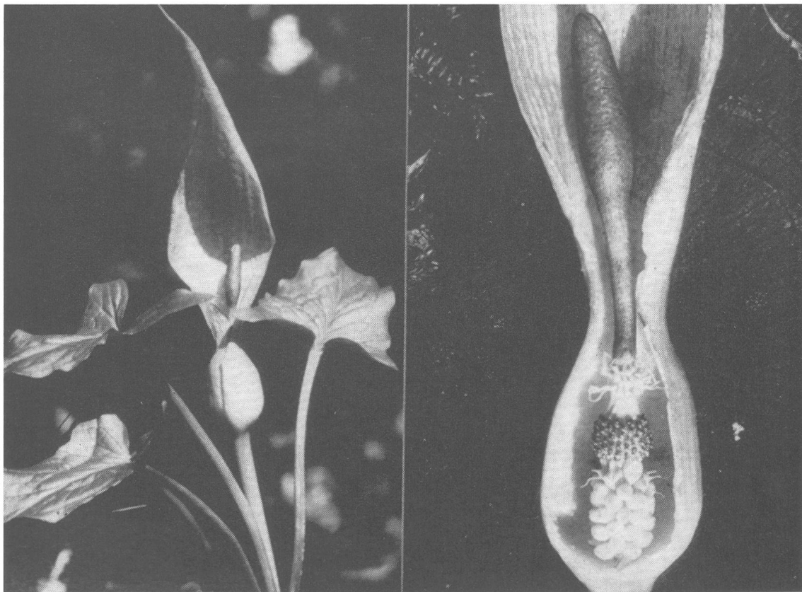
Aronstab: links: blühende Pflanze; rechts: Blütenstand nach Entfernung des Hüllblattes: Stab-, Reuse-, Staubblätter-Fruktknoten

Eine liebliche Vorfrühlingspflanze, ein Halbstrauch (Zwischenform zwischen Pflanze und Strauch), ist der stark duftende Seidelbast ( Daphne mezereum ), dem auch der Name Kellerhals