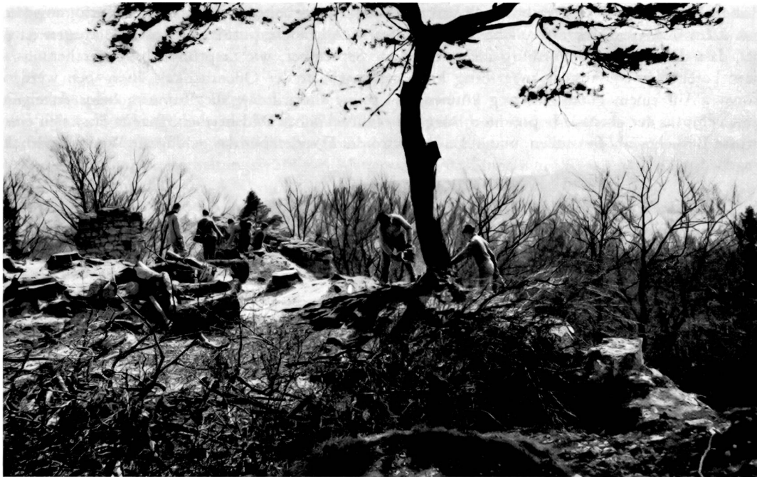
Alt-Wartburg bei Beginn der Arbeiten: bis zur Mauerkrone mit Schutt gefüllt und mit Bäumen bewachsen.

Das Ökonomiegebäude wurde vom 12. bis 19. Jahrhundert benützt. Es konnten auch hier mehrere Bautapppen festgestellt werden. Der Baukomplex diente früher den Burgbewohnern und später dem Hochwächter zur landwirtschaftlichen Selbstversorgung. Es wurde von jeher, also auch von den Herren von Ifenthal, Viehzucht und Ackerbau betrieben. In den alten Kaufverträgen sind auch Obstbäume und ein Gemüsegarten erwähnt, und das Gut umfasste rund 20 Jucharten Weid- und Ackerland. Auch das Ökonomiegebäude wies einen Kachelofen auf, wurde aber nicht zu Wohnzwecken benützt.