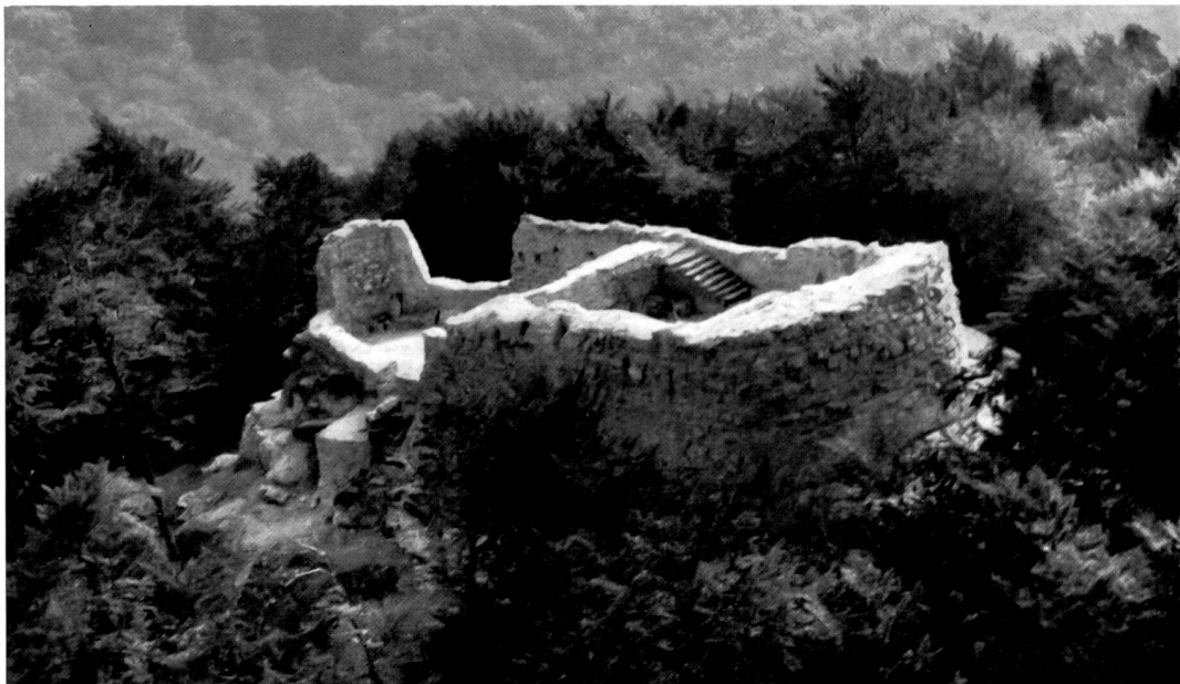
Alt-Wartburg von Nordost. Vorne links Burgweg, Brücke und Tor. Kellertreppe im Wohnturm.