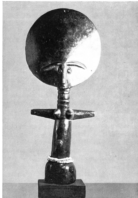
Akuaba-Puppe der Ashanti, Ghana. Diese Puppe, ein Bild der lunaren Muttergöttin, wird von den Mädchen im Hüfttuch getragen, damit sie dereinst schöne Kinder bekommen. – Privatsammlung, Olten.

Wenn es dem Menschen möglich ist, die Lebenskraft durch ihr Tun und Lassen zu mehren, hat er auch die freie Wahl zwischen positiven und negativen, aufbauenden und zerstörenden Kräften, also zwischen Gut und Böse. In diesem Wissen äussert sich das ethische Bewusstsein der Bantu, das Lüge, Diebstahl und böse Zauberei von sich weist, um damit nicht das Gleichgewicht und die Ordnung im Weltall zu stören.