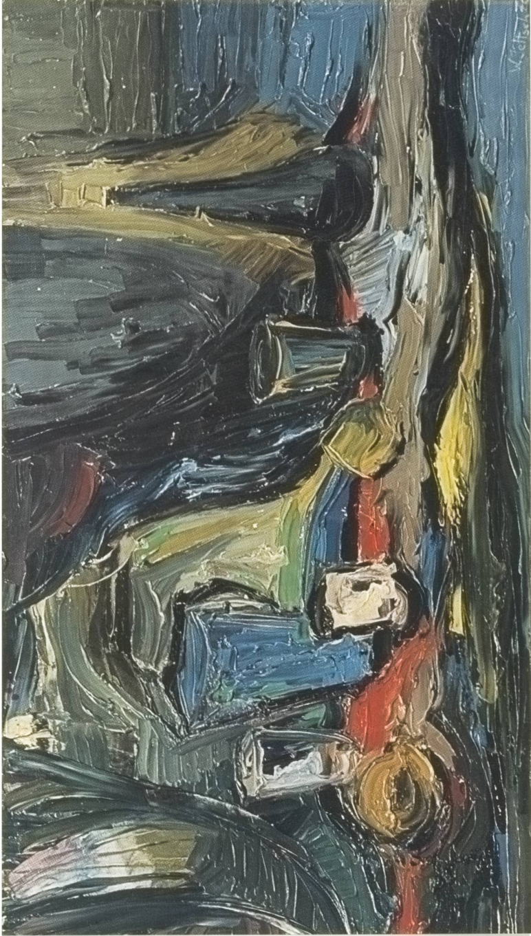
«Stilleben mit blauem Krug»