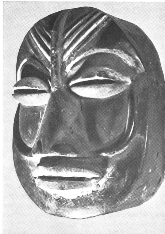
Maske der Kran (Guéré-Wobé). Die Dan-Kran-Völker des Hinterlandes der Elfenbeinküste weisen eine ausserordentliche Vielfalt von expressiven Masken auf. – Privatsammlung, Olten.

In diesem Zusammenhang sei darauf hingewiesen, dass die heutigen Ethnologen die gemeinsamen Ursprünge allen Maskenwesens (also auch des europäischen) erkannt haben; sie liegen in einer uralten, in «zivilisierten» Gegenden vergessenen und ins Unbewusste verdrängten Ahnenreligion. Von den Löttschentaler Masken sagt Karl Meuli beispielsweise: «...dass das ganze Treiben für das Gedeihen von Mensch, Tier und Pflanze nützlich, ja nötig sei, das scheint dem Bewusstsein entschwunden zu sein. Merkwürdig ist die im Namen ‚Roitschäggätä‘ bewahrte Vorstellung, die dämonischen Wesen kämen aus dem Kamin. Im Maggialtal glaubt man, in dem grossen Schlot, aus dem die Ketten zum Befestigen der Kessel auf die offene Feuerstätte herabhängen, wohnen die Seelen der Toten des Hauses, und man hütet sich, die