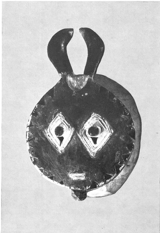
Zeremonienmaske Kplekple der Baule (bekannt auch unter der Bezeichnung Guli). Elfenbeinküste. Mit ihrem Scheibengesicht ist sie der Symbolik der Sonnenmächte zuzuordnen. – Privatsammlung, Olten.

Das von Meuli beschriebene Walten der «Masken», die fast immer und überall im Besitz der Männerbünde sind, gilt auch für Afrika: «Je ferner und höher die dargestellten Ahnen sind, desto weiter entfernt sich ihre Maskengestalt vom Individuellen, um sich immer mehr im Ausdruck des Numinosen überhaupt zu versuchen. Am unzweideutigsten aber sagt es ihr ganzes Benehmen, dass sie Geister, Tote sind. Ihre Bewegung ist nicht der nüchtern-zweckmässige Schritt; sie ist geisterhaft gesteigert, zauberhaft schnell oder feierlich geheimnisvoll, fast immer streng rhythmisiert zum Tanz. Geisterhaftes Getön umschwebt sie: Trom-