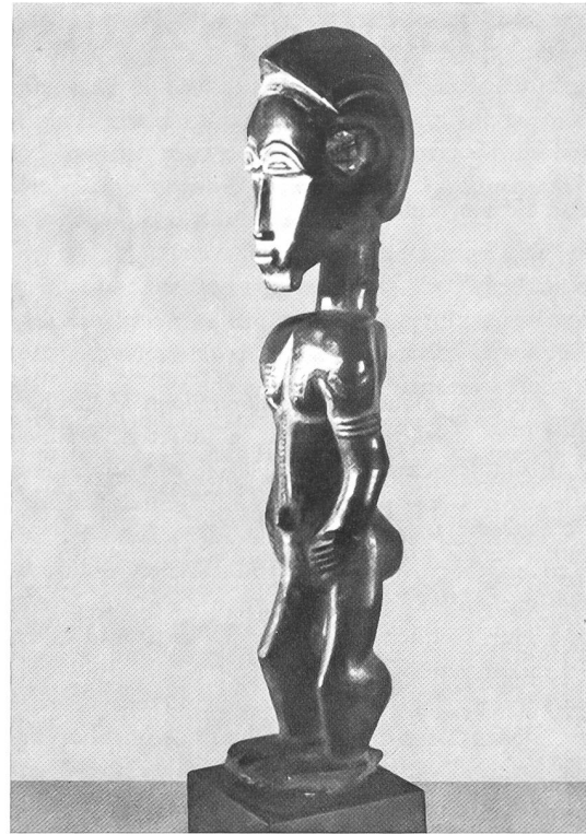
Ahnenfigur der Baule. Elfenbeinküste. Die Ahnen vermitteln zwischen den Lebenden und der unsichtbaren Welt, aus der die zum Fortbestand des Lebenslaufes notwendigen Energien hervorgehen. Privatsammlung, Olten.

kunst und Kubismus» kommt Kahnweiler zum Schluss: «Es handelt sich nicht um einen Einfluss der Negerkunst auf die Kubisten, sondern auf eine bei Beginn eines Bruchs mit der bestehenden Tradition häufig zu beobachtenden Erscheinung: man sucht Bestätigung, indem man anderswo in Zeit und Raum jene neuen Tendenzen wiederfindet, zu denen man sich bekannt hat... 1 »