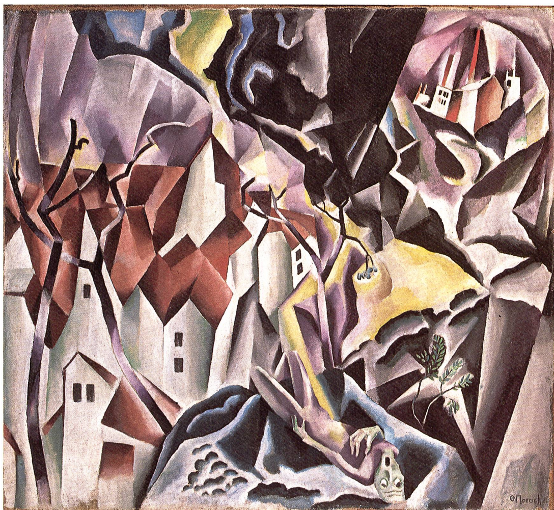
Otto Morach (1887–1973) Sterben im Krieg , 1915 Öl auf Leinwand, 90×100 cm Ankauf 1967