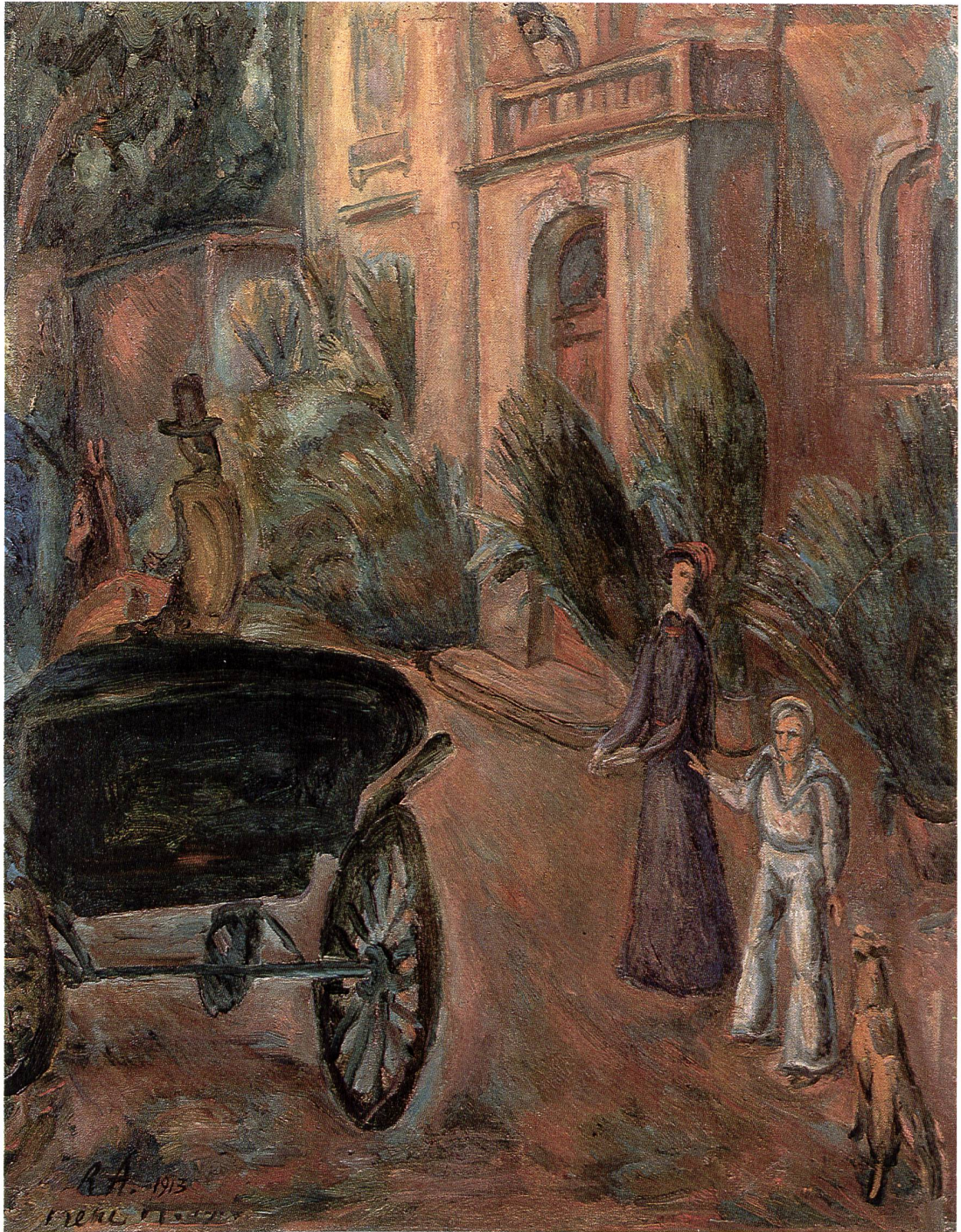
René Auberjonois (1872–1957) La promenade, 1913 Öl auf Leinwand, 67,5 × 52,5 cm Schenkung der Solothurner Kantonalbank 1972

die Beseitigung der beiden Schaufenster erhielt das Erdgeschoss mehr Raum und Licht. Gleichzeitig wurde das Museum gegen aussen geöffnet. Die Lage des grossen Parterreräumes, ebenerdig zur belebten Strasse, eignet sich ideal für Wechselausstellungen. Nach dem Umbau von 1970 war man