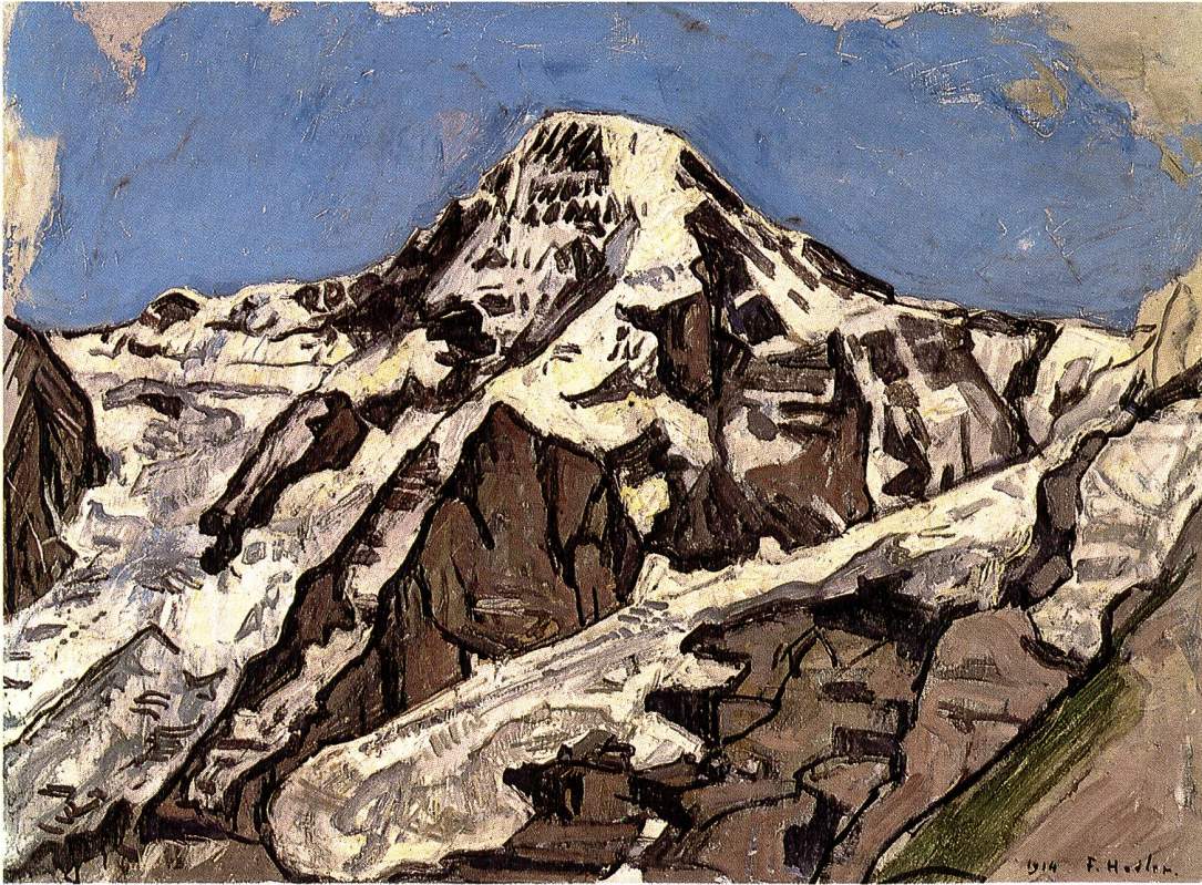
Ferdinand Hodler (1853–1918) Mönch , 1914 Öl auf Leinwand, 62×86 cm Ankauf 1967