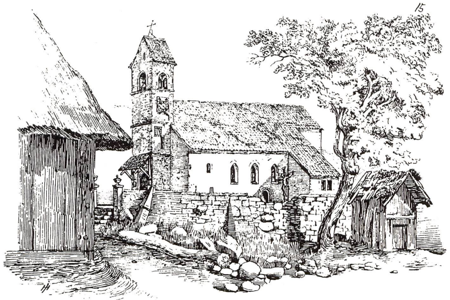
So präsentierte sich die ehemalige Dorfkirche zu Hägendorf, als die Oltner noch nach Hägendorf wallfahrien.

ein anderes dafür aúf zú bauwen versprochen worden. Wirt hieúon die abredt geschechen, ob nicht alldort ein andere cappelin oder creütz kónte aúfgericht werden.» 57 Dürfen wir, gestützt auf die beiden Einträge und auf die Tatsache, dass später der feierliche Gottesdienst am Festtag der Kreuzauffindung in der 1603 erbauten Kreuzkapelle vor dem Obertor 58 gehalten wurde 59 , annehmen, dass es sich schon bei der im Jahrzeitbuch erwähnten Kapelle bei dem Tor nach Schönenwerd um eine Heiligkreuzkapelle gehandelt habe? Sicher belegt ist durch die zitierten Einträge jedenfalls, dass der Kreuzgang nach Wolfwil, über dessen Rahmen der Stadtrat zu Olten am 5. Mai 1734 Beschluss fasste 60 , und der laut der Zusammenstellung über die kirchlichen Bräuche von Pfarrer Bürgi «nach alter Gewohnheit und Gelübnis wegen dem Hagel» gehalten wurde 61 , nicht vor dem 18. Jahrhundert eingeführt worden sein dürfte. Er war denn auch der erste Kreuzgang, der wieder abgeschafft wurde, indem die Gemeinde 1804 beschloss, von nun an statt nach Wolfwil nach Hägendorf zu ziehen 62 . Dort war nämlich anno 1771 auf Be-