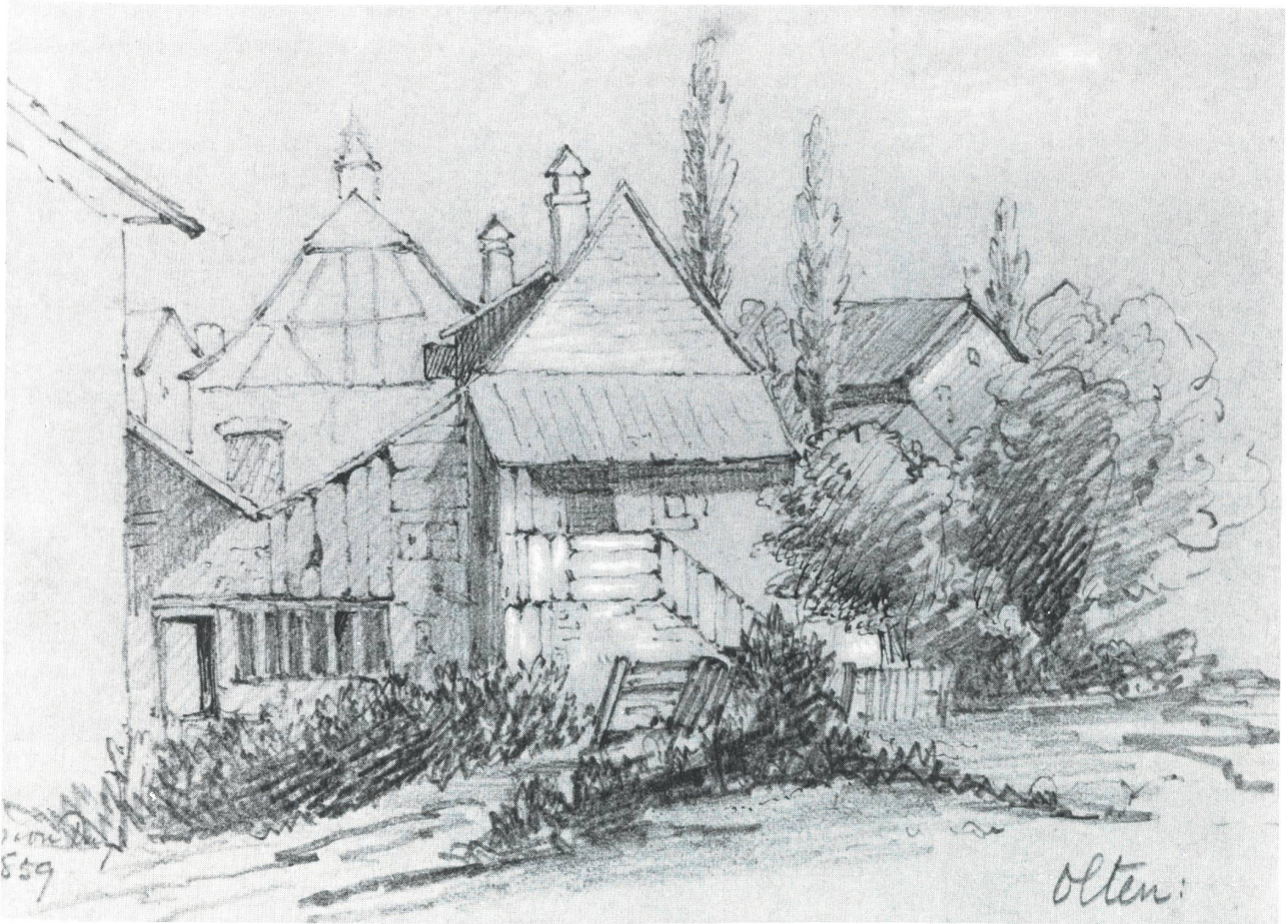
Blick auf das alte Hübeliquartier, Zeichnung (James Cockburn zugeschrieben), 1859.