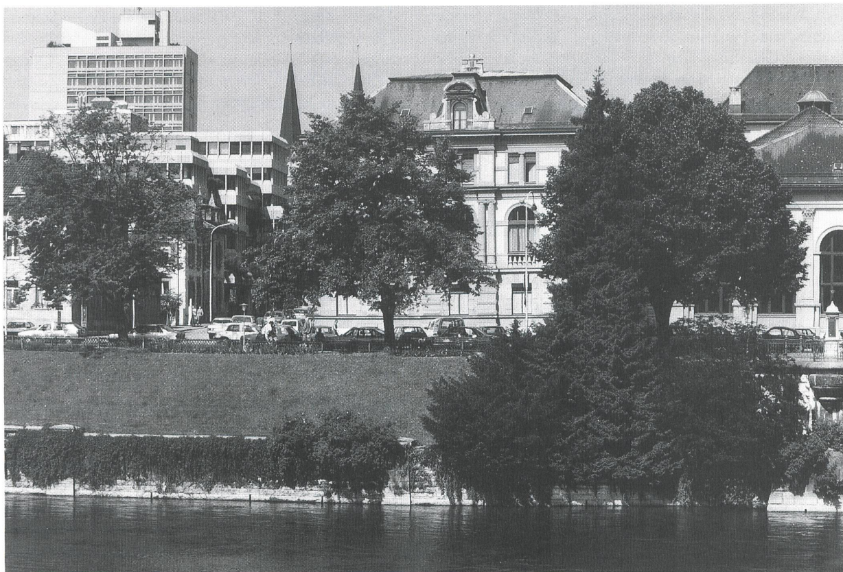
Schicksalhafte Reihe: kranker Baum, kränkelder Baum, gesunder Baum

liches Raumvolumen unter der Erde), durch Aushubarbeiten im Wurzelbereich und durch Salzablagerungen. Durch Asphaltierung oder Betonierung des Wurzelbereichs wird die Belüftung und Befeuchtung der Wurzeln eingeschränkt oder gar verhindert, und die entstehende Hitzeabstrahlung gefährdet die Krone. Dazu kommen Verletzungen der Rinde, die gefährliche Angriffsflächen für Pilze und Bakterien bieten.