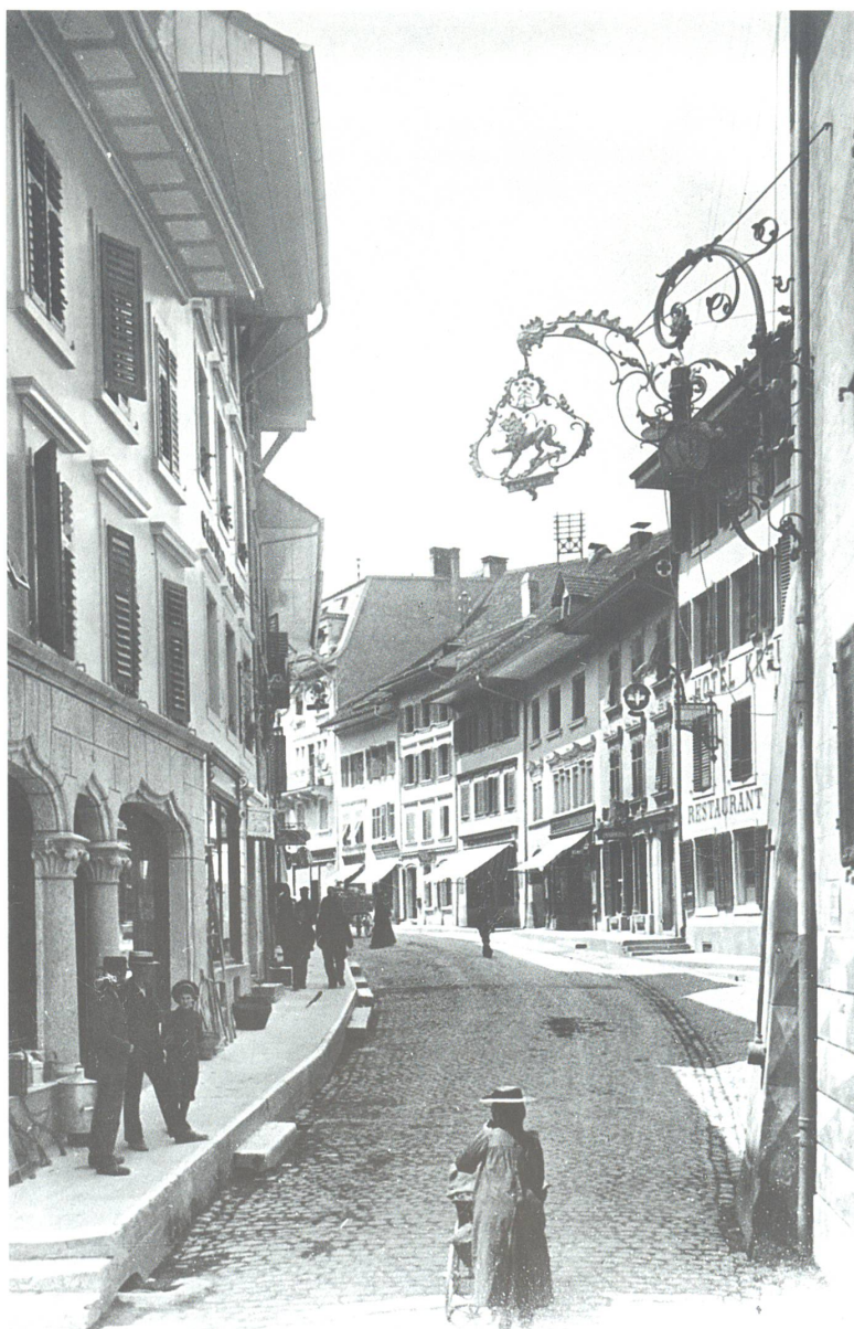
Blick in die Hauptgasse um 1900. Man beachte auf der linken Strassenseite das hohe Trottoir; am linken Bildrand das Geschäftshaus des damaligen Negotianten Bonaventur Meyer (später Victor Meyer).

Die Oltner Altstadt und ihr Brückenkopf in alten und neuen Bildern