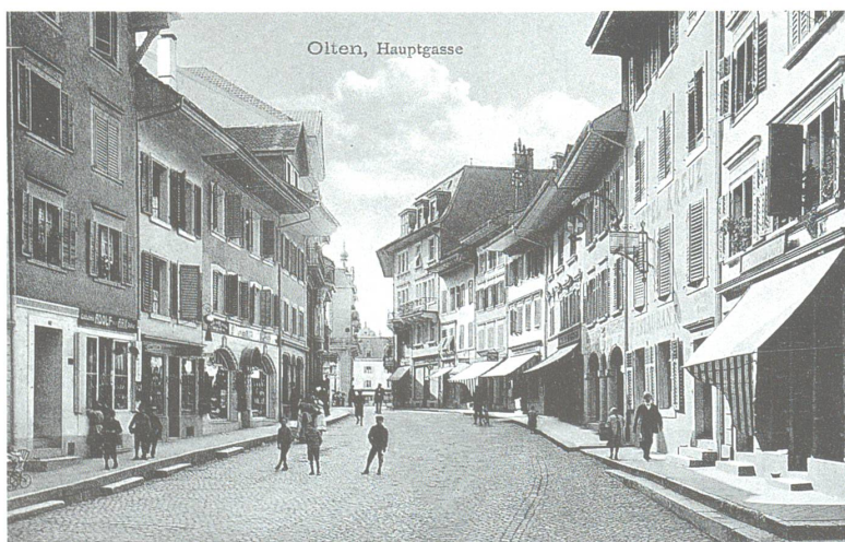
Links unten: Blick in die Hauptgasse um 1914. Sehr schön sind auf der linken und auf der rechten Strassenseite die einzelnen Häu- ser zu unterscheiden.

Verlaufe der Jahrzehnte aus Einzelhäu- sern die grossen Gebäude der Kauf- häuser «Victor Meyer» und «von Fel- bert» sowie das Modehaus «Bern- heim» entstanden sind. Gerade dieses Zusammenfügen von individuell un- terscheidbaren Häusern zu einem grösseren – und zumeist optisch massi- vereren – Bauwerk mag das Erschei- nungsbild einer Strasse stärker beein- flussen als bauliche Veränderungen an einzelnen Gebäuden.