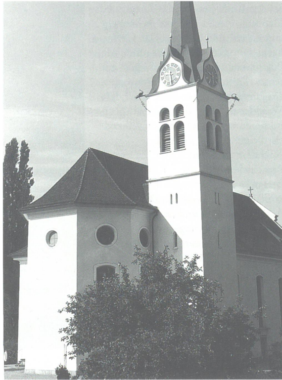
Kirche von Ettiswil