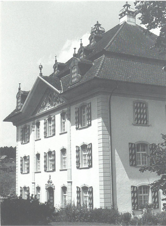
Sommerresidenz der Äbte von St. Urban in Pfaffnau