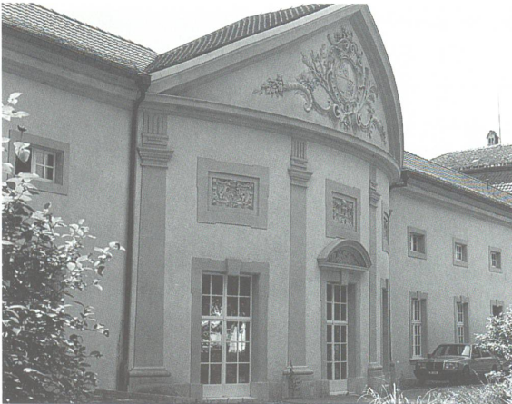
△ Orangerie von St. Urban

Quellen und Literatur: Purtschert-Akten im Stadtarchiv Olten Fischer Eduard, 150 Jahre Stadtkirche Olten. Oltner Geschichtsblätter vom 11. 6. 1955 Guldemann Anton, Die Stadtkirche von Olten und ihr Architekt. «Oltner Neujahrsblätter» 1954 Lörtscher Gottlieb, Über die Stadtkirche von Olten und deren Türme. «Oltner Tagblatt» vom 29. 8. 1964 Meier Emil, Einige Mitteilungen über den Bau der Pfarrkirche Olten. Olten 1901 Purtschert Werner V., Die Baumeisterfamilie Purtschert in der Schweiz. Zeitschrift des Verbandes der Namensträger, Nr. 2, Dornbirn 1970 Reinle Adolf, Die Kunstdenkmäler des Kantons Luzern, Bd. 6, Basel 1963 Wyss Gottlieb, Von der Oltner Stadtkirche. «Christkath. Kirchenblatt» Nr. 11, 1955 Kunstführer durch die Schweiz, Bd. 1, Wabern 1971 (Herrn Stadtarchivar Martin Eduard Fischer danke ich für die Bereitstellung der Unterlagen.)