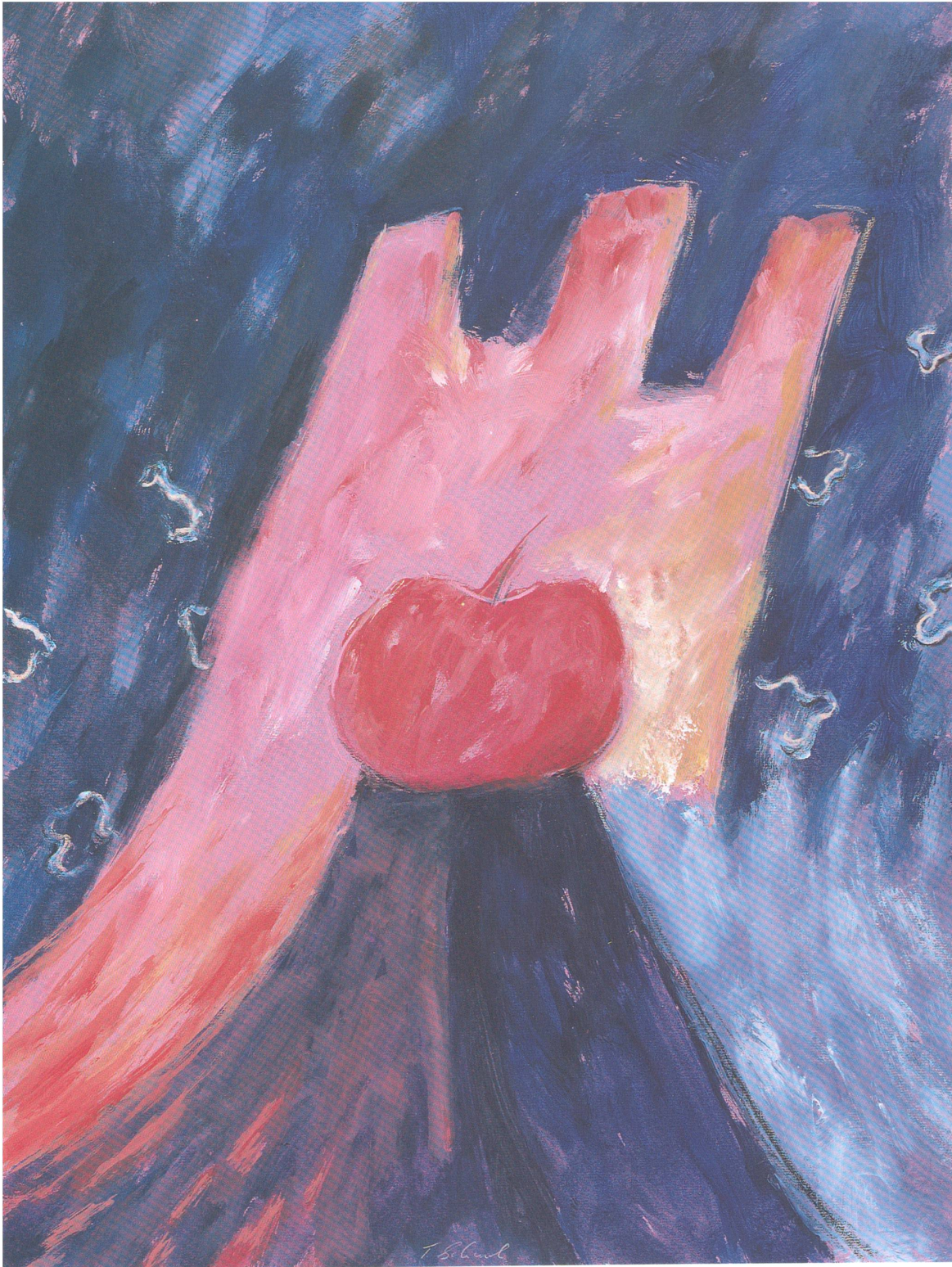
Thomas Schaub, «Eva ist nahe», 1993, Acryl auf Papier, 60 x 45 cm