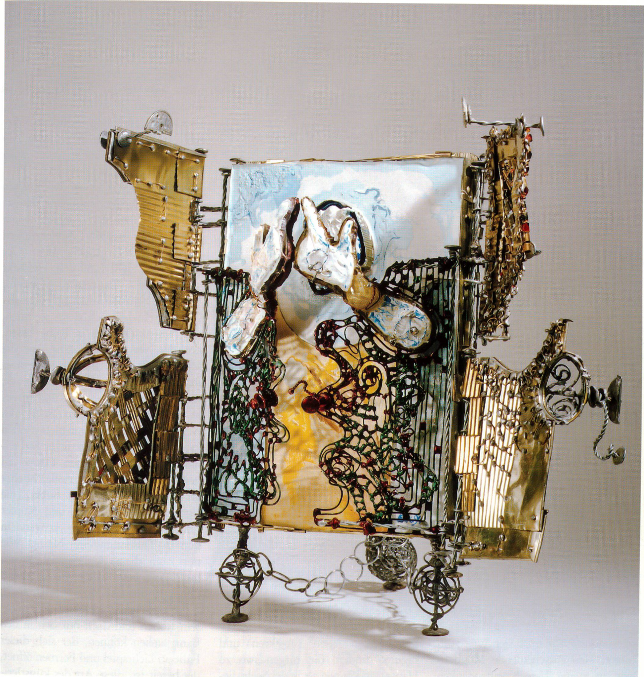
Fundstücke 2, Blech, Draht, Hartgips, bemalt 50 x 40, 1994

Malen und das Werken weiterzugeben, fand er in diesem Beruf. Der Lehrerberuf ist für ihn ein wichtiger Beruf, wesentlich für unsere Gesellschaft. Während dieser Phasen entstehen immer wieder Arbeiten, Zeichnungen, gemalte Bilder, kleine Objekte, oder dann verfällt er einer Sammelwut, sucht Weggeworfenes, weil er instinktiv weiss, dass es einem irgendeinmal wichtig werden könnte.