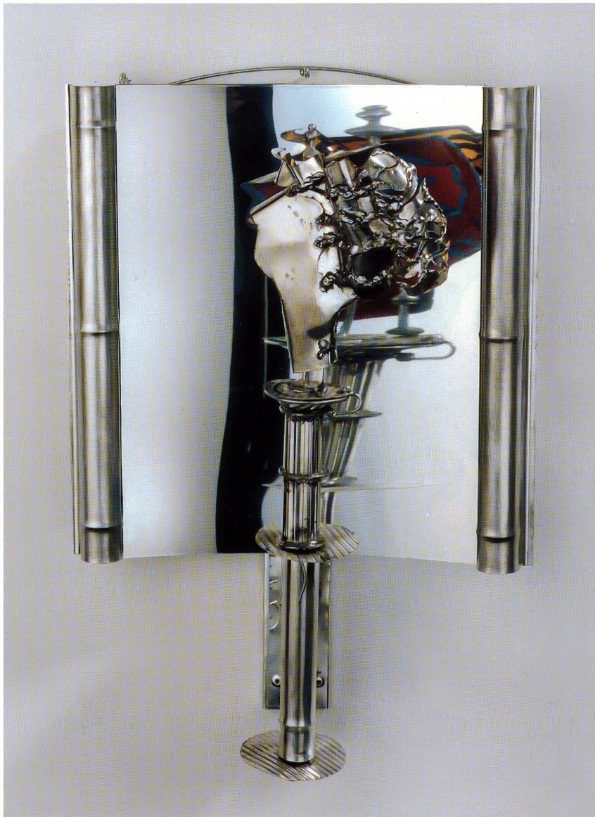
Pendel-Pendelubren oder -köpfe, drehbare Köpfe vor Spiegel 35 x 24 cm

schwundung, für mich der Weg zum Inhalt, eine entscheidende Möglichkeit, in meine Tiefe hineinzudenken und -zuhorchen, daraus irgendwelche Vorstellungen zu entwickeln, die dann zu einem ganz bestimmten Zeitpunkt Formen annehmen. Was ist schon Zeit, wenn man bedenkt, dass man sowieso nie welche zu viel hat, dass man in den dümmsten Augenblicken warten muss, um dann in den schönsten davonzueilen?» Erwin Knoblauch lässt sich nicht hetzen, dies ist gut so, denn nur dank dieser Gelassenheit, die von viel Schmerz, innerer Unruhe, Unsicherheit und Suche gekennzeichnet ist, kann man zu solch ungewohn-