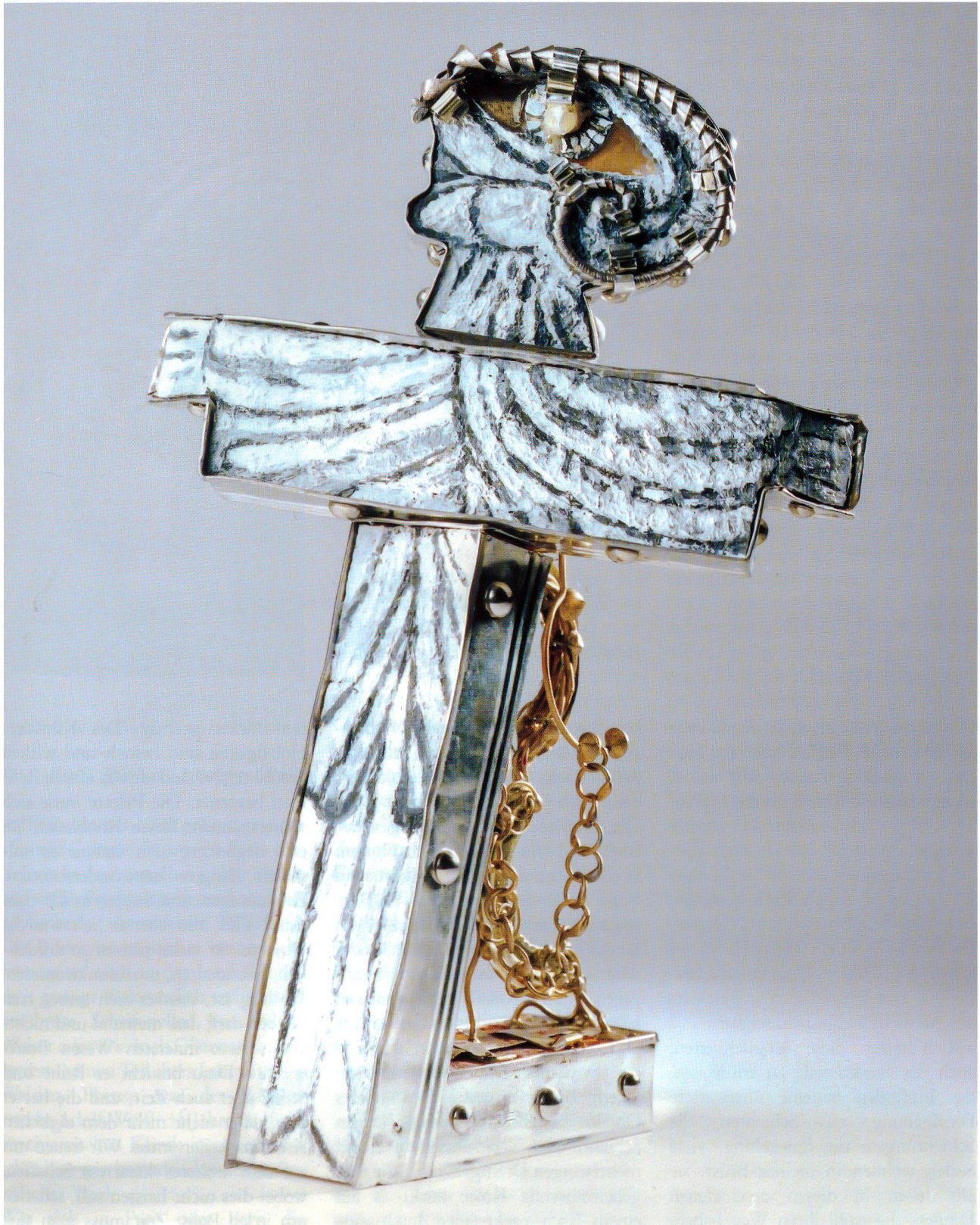
Figur – vielleicht ein Engel oder der Gedanke an Geborgenheit