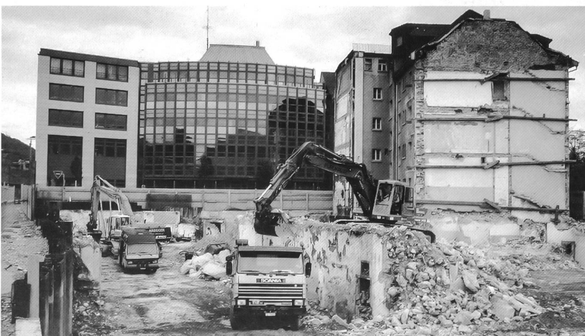
Abbruch des Telecom-Gebäudes