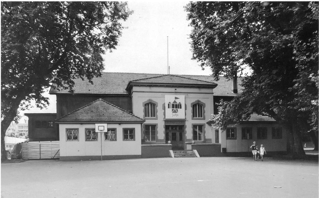
Seite 88: Verhüllungen: Haus des Schweizerischen Samariterbundes, Hübelischulhaus: Renovation der Fassade, Bahnhofumbau, Gleis 7, Postcheckamt, Disteli-Haus sowie Hauptpost- und Atelgebäude