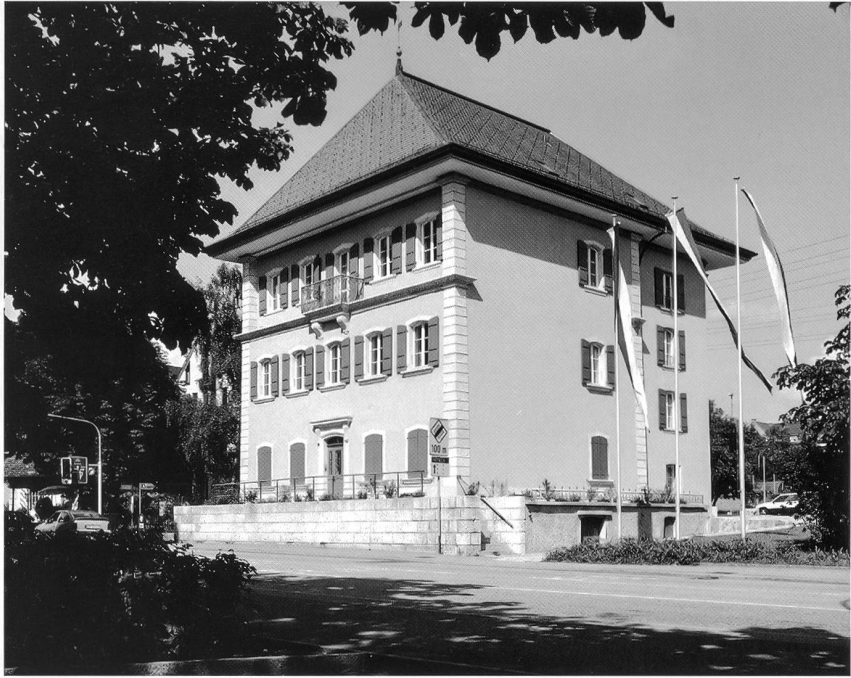
Seite 86 oben: Im Feigel: Römerfunde und der neue Feigelhof im Bau Mitte: Fritz Flickiger, Fuhrhalterei, und die neuen Parkplätze an der Leberngasse Unten: Die ehemalige Villa an der Ecke Von-Roll-Strasse, Aarauerstrasse und die heutige Parkplatzsituation

riert und eine neue, helle Hauptunterführung sowie ein zweiter vollständiger Durchgang Nord geschaffen, womit wohl der Bahnhof Olten ein für allemal als Labyrinth ausgedient hat! Es kamen neue Geleiseanlagen dazu, mit zweckmässigen Zugängen. Ist die Gesamtanlage nicht viel übersichtlicher, sicherer, ansprechender und kundenfreundlicher geworden, mit schönen Kiosken, Geschäften, Auslagen und auch schnellen Fahrkartenautomaten? – Es wäre wirklich zu hoffen, dass nun auch das Drogenelend in der Bahnhofregion durch konsequente und menschliche Massnahmen interregional gemildert, ja behoben werden kann. Je mehr hier bisher von den Verantwortlichen getan worden ist, desto mehr hat der Zulauf aus der ganzen Schweiz zugenommen!