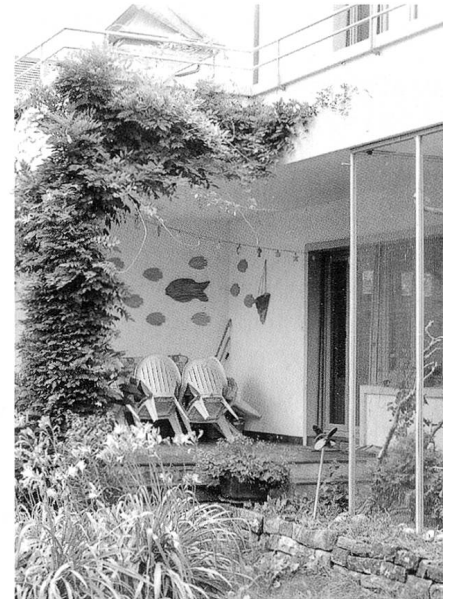
Das Haus an der Martin-Disteli-Strasse in Olten heute

Im Jahr 1987 – ich lebte damals im Ausland – verstarb meine Grossmutter, und ihr Haus an der Martin-Disteli-Strasse 53 wurde verkauft. Es stand lange leer, und aus dem Garten wurden Granitplatten und Pflanzen entwendet. Schliesslich wurde die Liegenschaft von einer Privatpartei gekauft und renoviert. Ich war froh, alles wieder herausgeputzt zu sehen. Die dicken rostigen Geländer auf der Terrasse waren neu bemalt. Violett. Genauso die Fensterrahmen. Das war ihre Farbe gewesen. «Madame Violett» hatten sie meine Schulkameraden genannt. Sie war stadtbekannt gewesen für ihre Vorliebe zu violetter Kleidung für sich selbst und ihren Hund. Dieses Farbenzitat konnte kein Zufall sein. Da ich mich nie vom Haus hatte verabschieden können, wollte ich es mir noch einmal anschauen.