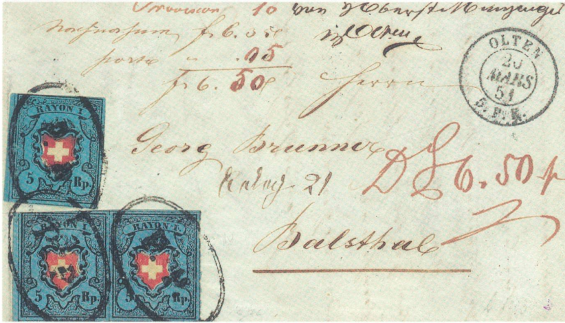
Die ersten Bundesmarken. Nachnahmebrief mit 3 dunkelblauen Rayons mit P.P. von Olten im Oval, Taxe für Brief bis 1/2 Loth Gewicht im 1. Briefkreis 5 Rp. Provision 10 Rp. = 15 Rappen.

«Sammler sind glückliche Menschen», sagt ein Sprichwort, und wirklich ist Sammeln eine Leidenschaft – meine Leidenschaft. Als ich zehn Jahre alt war, hatte ich bereits eine kleine Briefmarkensammlung angelegt. Diese Freude an der Philatelie liess mich seither nicht mehr los. Noch immer bin ich von den kleinen Bildchen auf Briefen und Karten fasziniert. Dabei ist mir die Freude an einem schönen Stück bedeutend wichtiger als der materielle Wert. Die Themengebiete in der Philatelie sind grenzenlos. Ich habe vor über vierzig Jahren begonnen, eine Heimatsammlung aufzubauen. Meine Themen lauten: Olten und Tripolis bei Olten. Ich suche in der Schweiz und im benachbarten Ausland nach Briefen, Karten, Marken und anderen postalischen Objekten, die irgendwie mit Olten etwas zu tun haben. Sie müssen in Olten aufgegeben worden sein, eine Adresse nach Olten aufweisen oder ein Bild von Olten zeigen. Um eine interessante, gute Sammlung aufzubauen, versuche ich möglichst viel von dem zu finden, was je hergestellt wurde und heute noch erhältlich ist. Das können Unikate sein, rare, teure oder auch kleine, fast wertlose Belege. Auch Briefe von Oltner