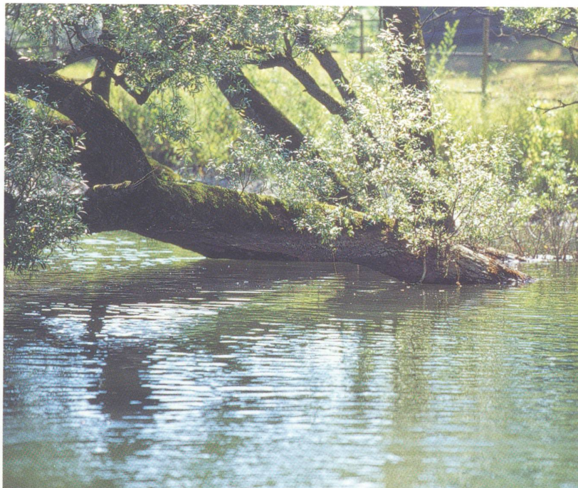
Naturnabe Flussufer sind das Ziel der zahlreichen baulichen Massnahmen entlang der Aare.

dingungen zu schaffen. Eine Mündungsrampe und neun Stromstellen helfen mit, den Höhenunterschied im unteren Abschnitt von 5,6 Metern zu überwinden. Das Gewässer mit einem durchschnittlichen Gefälle von drei Prozent wurde sehr vielfältig und naturnah strukturiert. Selbst die Kies-schichtungen weisen unterschiedliche Korngrößen auf.