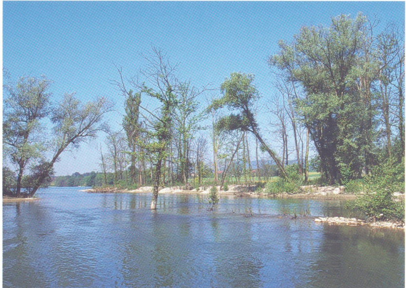
Die Boniger Inseln bleiben dank Kiesaufschüttungen bestehen. Ein Teil der alten Bäume wird jedoch wegen des Einstaus absterben.

Natur und Landschaft sowie der natürliche Fluss des Wassers werden durch den Bau von Wasserkraftwerken unweigerlich verändert. Diesem Umstand trug die Aare-Tessin AG für Elektrizität als Bauherrin lange vor Baubeginn Rechnung. Schliesslich sollte das neue Kraftwerk im Einklang mit der Natur entstehen. Atel schuf dazu eine Begleitkommission, bestehend aus Naturschützern, Fischern, WWF und Pro Natura, um die Chance einer Neuge-