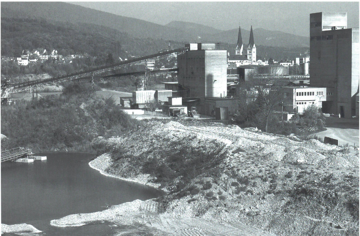
Das PCO-Areal, wie es sich im Frühjahr 2002 präsentierte

Im Juni stellte sich die Gruppe der Oltner Business-Götti der Öffentlichkeit vor, Unternehmer und Manager aus verschiedenen Branchen, die sich auf Initiative der Wirtschaftsförderung Region Olten, der Fachhochschule Solo-