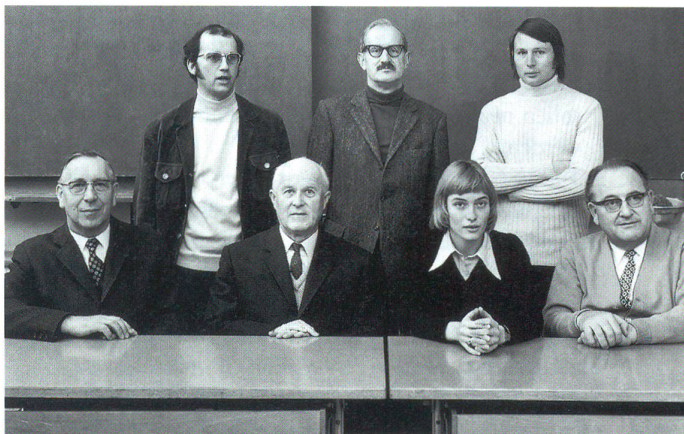
Das Sekundarschulkollegium im März 1973

• Die Idee einer dreigeteilten Oberstufe wurde ein Jahr nach Olten auch von der Stadt Solothurn aufgenommen. Sie ging allerdings in Bezug auf die Bezeichnungen ihrer Schulabteilungen eigene Wege. Erst im Jahre 1944 verlangte die Hauptstadt in aller Form die Eröffnung einer Sekundarschule als Mittelstufe zwischen Primar- und Bezirksschule. Den Durchbruch schaffte die Sekundarschu-