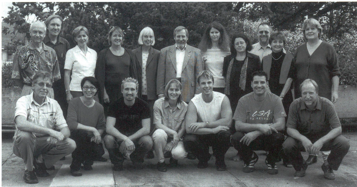
Das Team der Sekundarschule Olten im Schuljahr 2002/2003