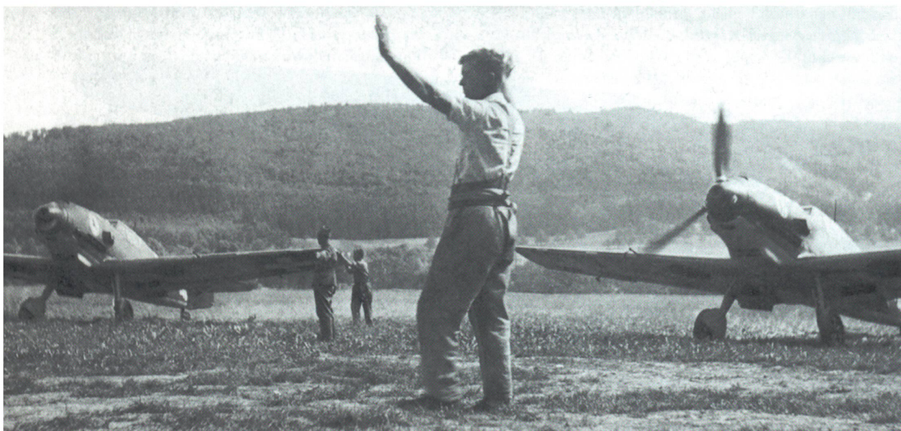
Der Flugplatz «Gheid» mit Messerschmitt 109. Deutlich ist im Hintergrund die gewölbte Silhouette des Börn zu erkennen.

Mit Hilfe seines Dienstbüchleins, des «NZZ»-Archivs und der Meteo Schweiz vermochte Ernst Weber das erwähnte Datum seiner Beobachtung und die damalige Wetterlage abzuklären: Eine labile Föhnlage mit einem wolkenlosen, aber schwülen Vormittag, auf den am späten Nachmittag Gewitter folgten, die einen kurzen Wetterumsturz einleiteten 11 .