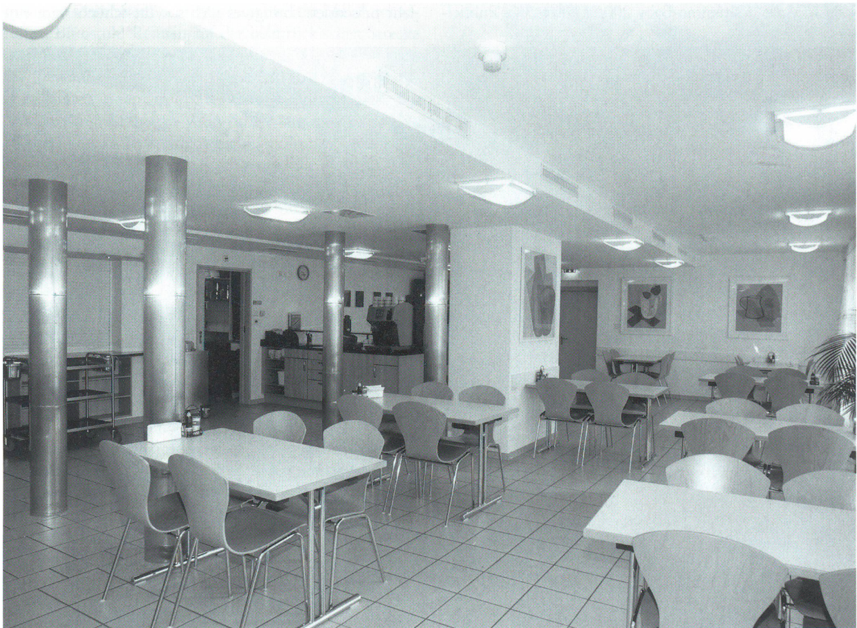
Esssaal im Wohnheim Bethlehem

Der Pensionär wird in der Regel so lange im Wohnheim bleiben, bis er die Anforderungen des Alltages wieder vollständig meistern kann. Die Heimleitung steht ihm bei der Suche nach einer passenden Wohnung und eines Arbeitsplatzes bei und ist bestrebt, dass der Pensionär die eingetübte Tagesstruktur innehalten kann.