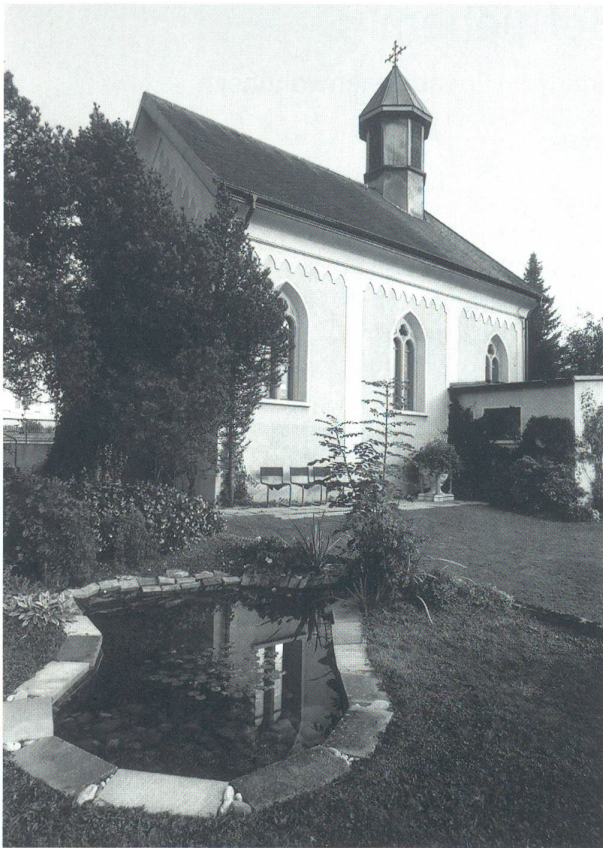
Kapelle gegenüber dem Wohnheim Bethlehem