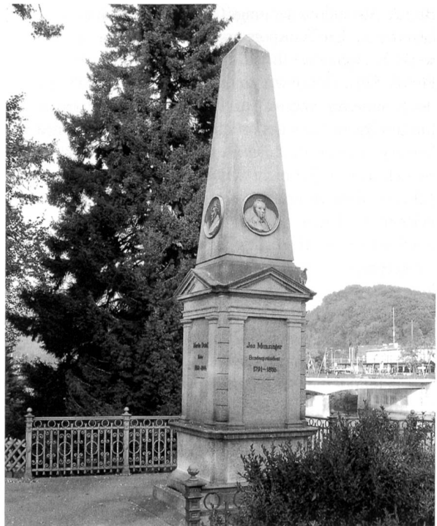
Das Denkmal am Amthausquai