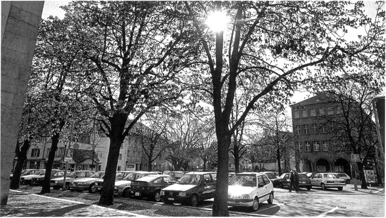
Der Munzingerplatz als Parkplatz

Zehnder wurde durch die Benennung einer Quartierstrasse unterhalb des Frohheimschulhauses verewigt. Der erste Oltner Bundesrat erhielt durch die Neuzeichnung des bisherigen «Kreuzackerplatzes» hinter der Stadtkirche ein zweites Denkmal. Dabei ist zu bemerken, dass sich der Name «Munzingerplatz» auf das gesamte Areal von der Kirchgasse bis hinter das Hübeli-Schulhaus bezog. Der alte Name des Platzes erinnert daran, dass sich an dieser Stelle einst ein Friedhof befand. Im Unterschied zur Errichtung des Obeliskens am Amthausquai handelte es sich diesmal um einen reinen Verwaltungsakt ohne jegliche Feierlichkeiten. Immerhin fanden auf dem Platz seither immer wieder festliche Anlässe statt, die aber mit der Person Josef Munzingers nichts zu tun hatten, und auch die heutige Zweckbestimmung des Areals als Autoparkplatz wird weder der historischen Bedeutung des grossen Staatsmannes noch der Würde des ehemaligen Gottesackers gerecht.