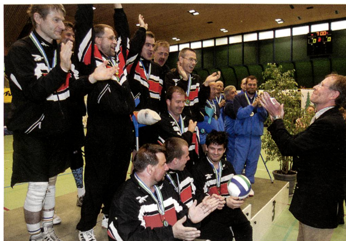
Europa-Pokal im Sitzball der Behinderten