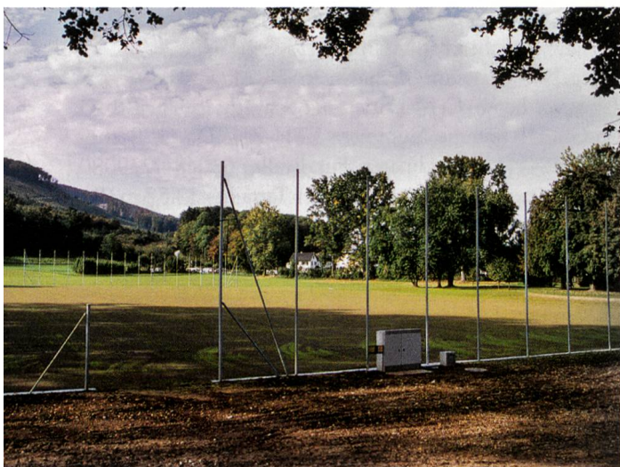
Neues Sportrasenfeld im Kleinholz