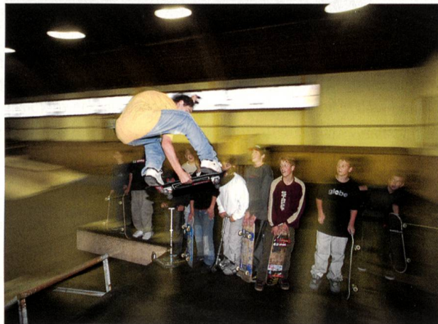
Trendsportanlage in der Reithalle 2004

Die Sportstättenplanung wird Olten in den kommenden Jahren stark beschäftigen. Das ehemalige Gebiet der Zementfabrik bietet ideale Möglichkeiten, und es liessen sich ohne weiteres auch grössere Projekte realisieren. Im Vordergrund steht dabei die Erstellung einer neuen Halle für den Eissport . Bei einer Sanierung der bestehenden Anlage am alten Ort muss mit so viel Kosten gerechnet werden, dass eine Verlegung des Standortes ernsthaft geprüft werden sollte. Es wäre auch ein positives Zeichen für den Eishockeyclub Olten, der dieses Jahr seinen 70. Geburtstag feiern kann.