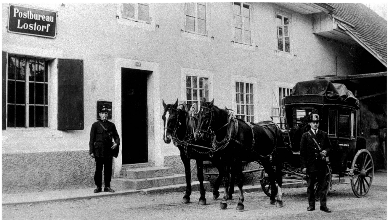
Postkutsche vor dem Postbüro Lostorf

Obwohl beide Versuche, das Gösgeramt mit einer Bahn zu erschliessen, misslangen, gab es doch eine für die Gemeinden bessere Verbindung mit der Stadt Olten. Drei