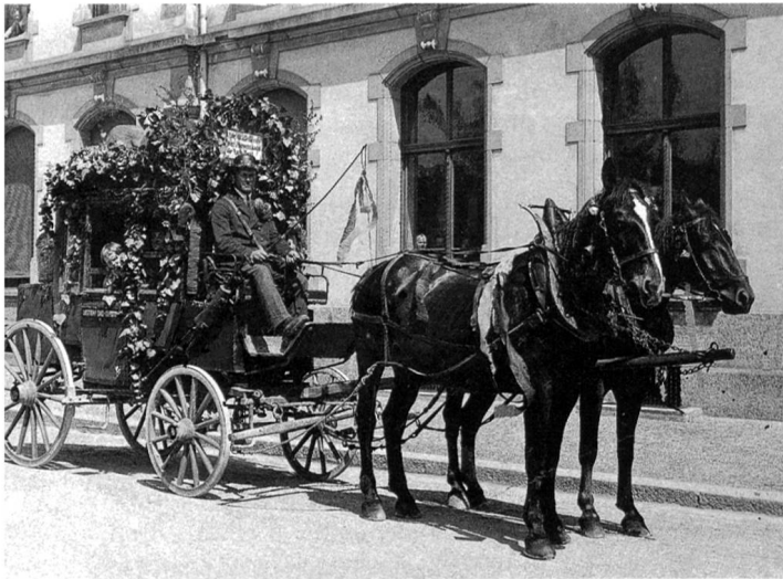
Rösslipost auf der letzten Fahrt. Auf dem bekränzten Schild steht: «Ade der Rösslipost, ab morgen verkehrt die Autopost.»

Jahre nach der Aufgabe des ersten Projektes wurde am 1. Juni 1874 eine Rösslipost in Betrieb genommen. Die Frequenz war sehr bescheiden. 1878 wurden im Jahr 52 Personen befördert. 1891 waren es sogar nur 18 Reisende. 1911 stieg die Zahl wieder auf 78. 1914 wurde das Gesuch für eine bessere Verbindung von der Oberpostdirektion positiv beantwortet und die Abfahrten von Olten aus um 8.30, 12.10 und 18.55 festgesetzt. Am 14. Mai fuhr die Rösslipost zum letzten Mal nach Lostorf.