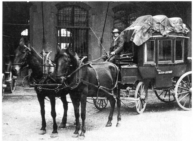
Rösslipost mit der Anschrift Olten–Lostorf vor dem Postlokal in Olten

Am 15. Mai 1924 konnte die Linie mit vier Fahrten in einer Richtung eröffnet werden. Die Fahrzeit mit dem voll-