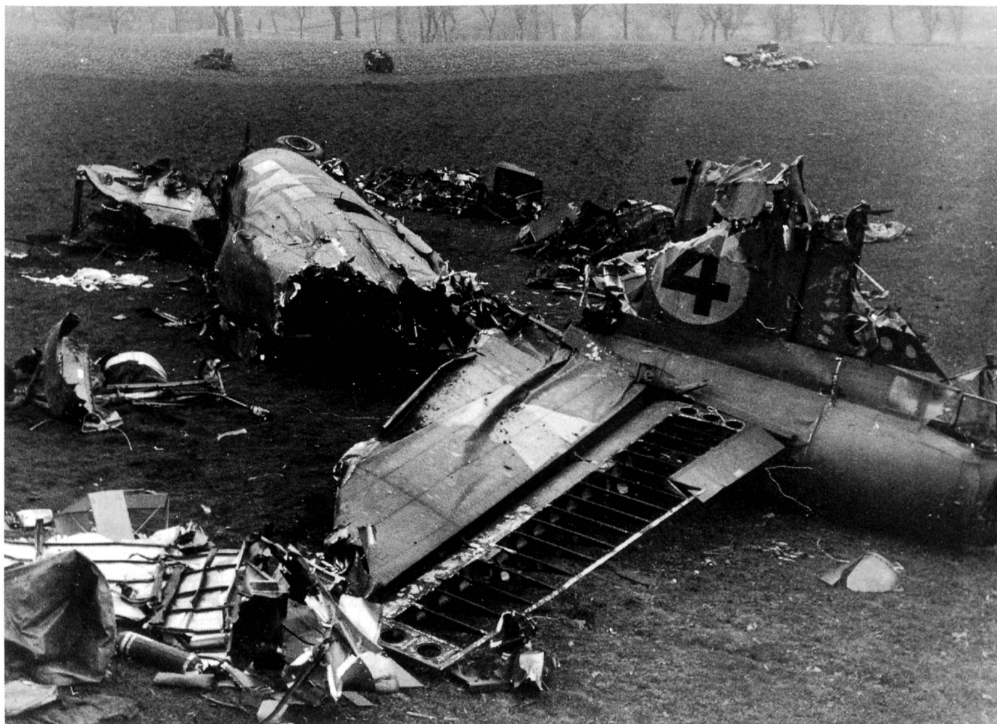
Hinterteil des Rumpfs und das Heck: gerade noch erkennbar der MG-Stand im Heck.