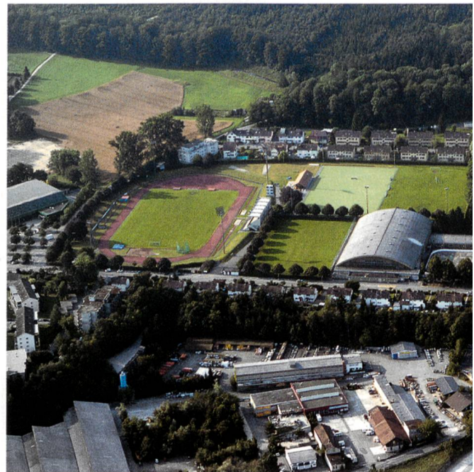
Sportanlagen im Kleinholz

Nebst den herausragenden Resultaten erfolgreicher Sportlerinnen und Sportler im vergangenen Jahre 2005 ist der Entscheid des Gemeindeparlamentes betreffend die Sportstättenplanung im Mai 2005 für die sportliche Zukunft unserer Stadt von grösster Tragweite. Der Stadtrat erhielt im September 2004 vom Parlament den Auftrag, eine strategische Planung im Bereich der Sportstätten vorzulegen. Grundlagen bildeten einerseits die prüfenswerte Idee, welche Sportstätten ins neue Gebiet Olten Süd-West verlegt werden könnten, und andererseits besteht bei der Eissporthalle dringender Sanierungsbedarf. Die vom Stadtrat eingesetzte Fachkommission legte bereits im Mai 2005 ihren Bericht vor, und das Gemeindeparlament entschied aus Kostengründen, am bisherigen bewährten Konzept der Konzentration der Anlagen im Kleinholzgebiet festzuhalten und vorläufig keine Verlegungen vorzunehmen. Gleichzeitig wurden Schritte zur Sanierung der bestehenden Anlagen eingeleitet. In den kommenden Jahren werden die Anlagen im Kleinholzgebiet inkl. die Eishalle überholt und dem neusten Stand angepasst.