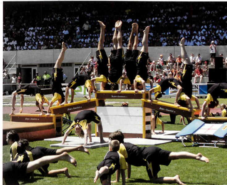
Sportfest 2005 – Schlussvorführung der Jugend