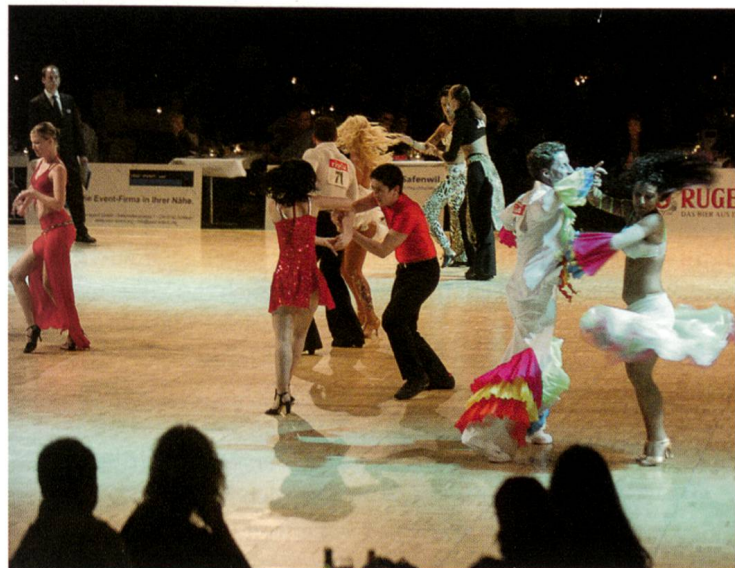
Weltmeisterschaften im Salsa- und Disco-Swing-Tanzen