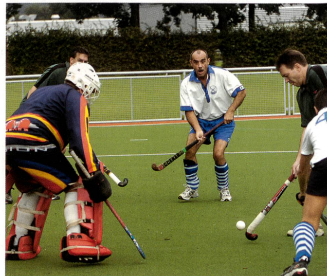
Landhockey auf dem neuen Kunstrasenplatz im Kleinholz