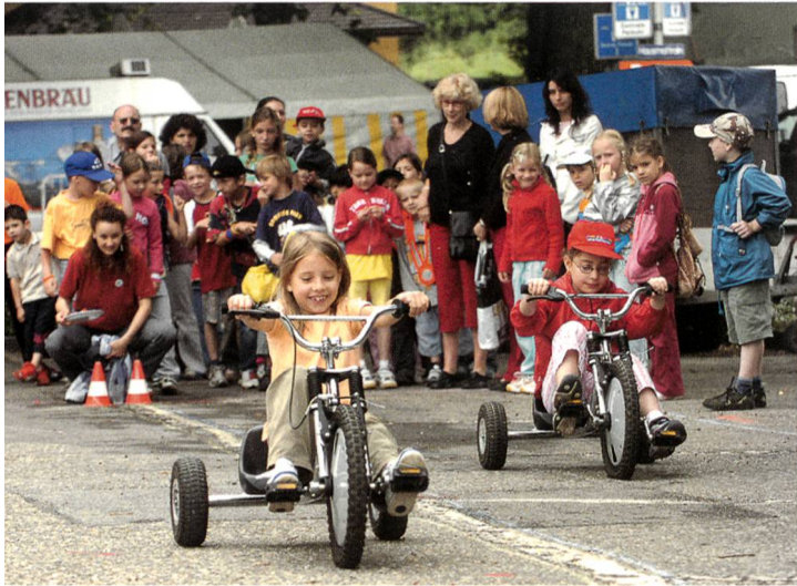
Volksolympiade am Schulfest 2005