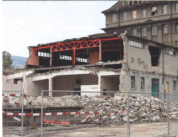
Olten SüdWest Ostflügel Usego vor und während dem Abbruch