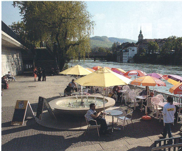
Rail Bistro Olten

Die Zeiten des Wirtschaftspessimismus scheinen nun auch in Olten endlich vorbei zu sein. Hatte man sich hier noch vor kurzem beim Bauen und Verändern eher in Vorsicht geübt, weil man sich vor einer weiteren Rezession, vor Arbeitslosigkeit und Abwanderung fürchtete, so hat sich nun das Blatt gewendet. Sparen war früher angesagt, man dachte eher an Rückstellungen als an Investitionen oder unternehmerische Wagnisse. Der Markt schien mehr als gesättigt; die vielen leeren Büroräume, Geschäfte und Wohnungen waren nicht zu übersehen; und eine grosse Zahl von Häusern stand während Monaten vergeblich zum Verkauf. Wo blieben die kaufkräftigen und innovativen Neuzuzüger, wo junge Ehepaare mit mehreren Kindern, die sich die teuren Wohnungen oder gar Häuser leisten konnten? Doch dann kam endlich die Wende, vorerst mit grösseren Fassadenrenovierungen, verbunden mit kleinen Anbauten und architektonischen Verbesserungen; es folgte der Umbau alter Gebäude, die Sanierung veralteter Wohnungen, die Umfunktionierung früherer Lagerhäuser oder Fabrikstätten zu Ateliers oder Verkaufszentren. Investoren brachten plötzlich wieder Wind ins Baugewerbe und machten Olten zum eigentlichen Zentrum eines neu erwachten Lebensgefühls wirtschaftlicher Zuversicht, begleitet von zahlreichen kulturellen, sportlichen, gemeinschaftlich-vergnüglichen Aktivitäten.