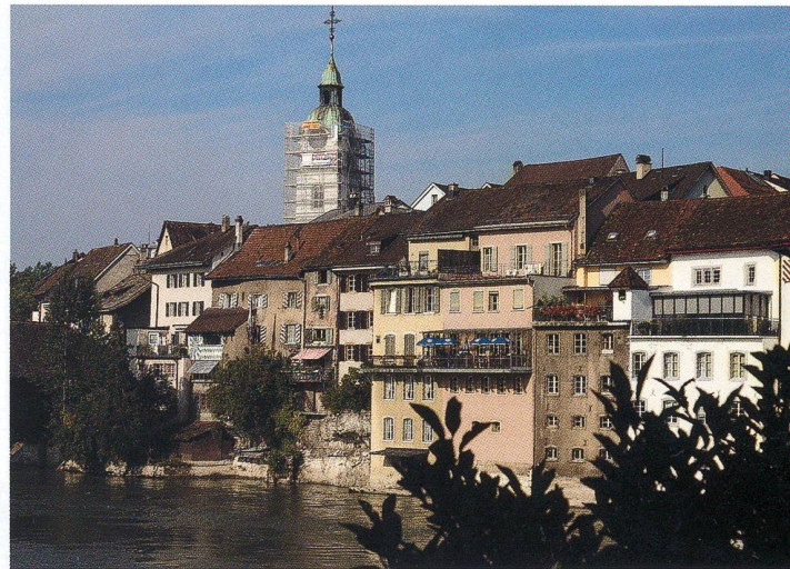
Renovation des Stadtturms

Kann man nicht die gelungene Renovation des alten Stadtturms als Symbol eines positiven Neubeginns verstehen? 1521 war er an die ehemalige Stadtkirche angebaut und im 17. Jahrhundert mit barockem Helm ausgestattet worden. Anlässlich der letzten grossen Renovation wurde 1928/29 beim ehemaligen Eingang zur Kirche auf der Westseite das Holzportal mit Beschlägen versehen und im europäischen