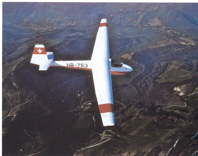
Auf dem alten Trainingssegelflugzeug K8B haben die Gebrüder Frey ihre ersten Streckenflugerfahrungen gesammelt.

Im 2007 wird die Segelfluggruppe Olten 75 Jahre alt. Aus diesem Anlass findet am 18./19. August 2007 auf dem Flugplatz Olten-Gheid ein grosser Flugtag statt. Das Historische Museum Olten plant eine Ausstellung zur Geschichte der Oltner Fliegerei, welche eine Woche vor dem Flugtag eröffnet werden soll.