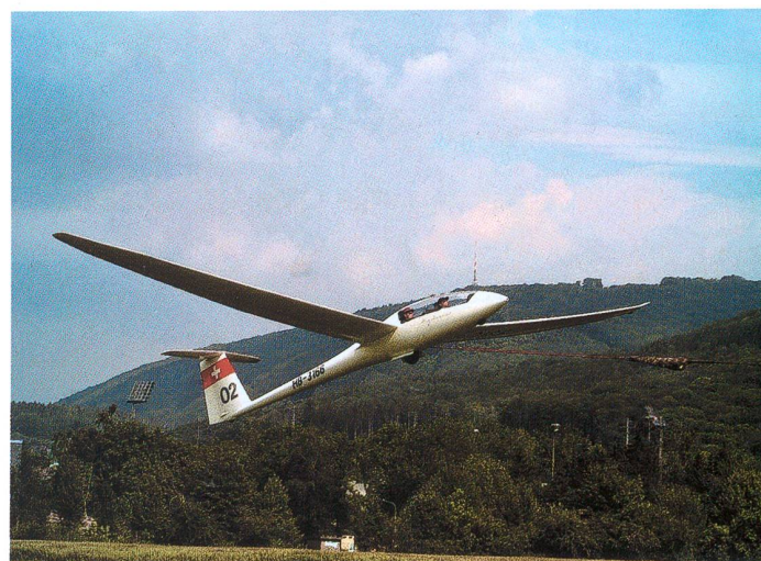
Der Oltner Leistungsdoppelsitzer Duo Discus, HB-3166, startet am 4. Juni 2006 an der Winde zu einem Streckenflug.